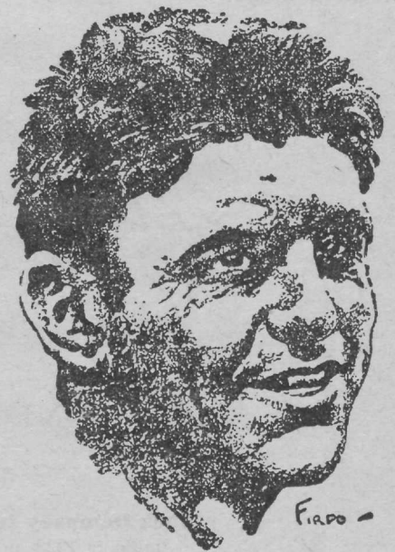
Luis Angel Firpo.

Iseenesest on Wills arukas mees, kelle eraelu on etteheideteta. Selles on ta võratult parem endiseaegsest ilmameistri- st neeger Jack Johnsonist ja Carpentier' võitjast neeger Battling Siki- st.