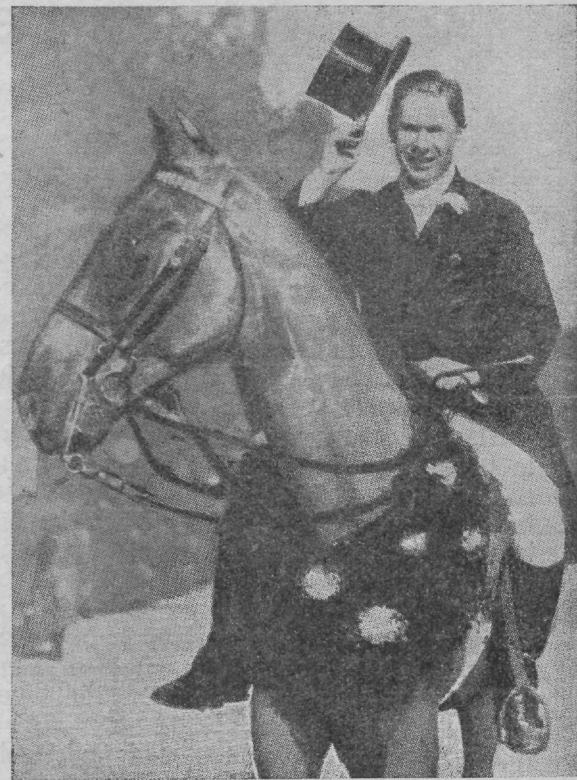
Jälle üks atleet... kinotäheks.

Südame häkiline nõrkus ülipingutuse tagajärjel tekkib selletõttu, et suurendud kehalik töö südamest erakordist tugevat töötamist nõuab. Kuid igal asjal on omad piirid — ning teataval momendil nõrgeneb, see on, väsib südamelihhas. Sügavate sissehingamiste puhul, kus rinnakastis negatiivne rõhumine valitseb, on rinnakasti veresooneid verrega enam täidetud kui harilikult, sest juurevool negatiivse rõhumise tõttu on kergendud. Seltsib nüüd sarnasel korral südame väsimusele veel juure asjaolu, et inimene „pingutab“, see on, et hingelöör keelpaelte kohal kinnitõmbub, vahelihas ülespoole tõuseb ja külljeluud fikseeritakse — siis tekkib rinnakastis tugev positiivne rõhumine, mis peasjalikult kopsu veresoontest verd loomulikult südamesse