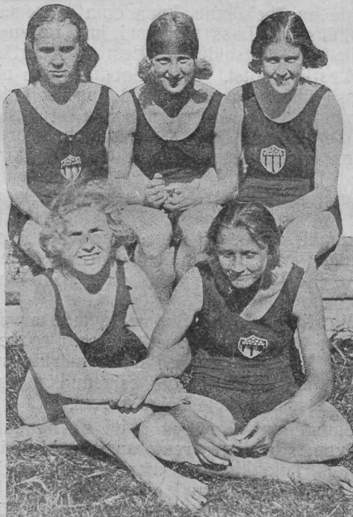
Paremad Tallinna naisujajad.

Mitmed Ameerika juhtkirjade kirjutajad on tähelepanu juhtinud rahvusvaheliste