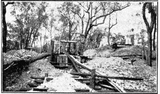
Koht Cracow'i kullakaevanduses, kus leiti esimesi kullalademeid.

kümnete eest töö ei annud tulemusi — seekord aga naeratas meestele õnn: nad leidsid mahajäetud august kulda! Praegune ettevõtte ostis meestelt kullaotsimise eesõiguse ära, makstes neile 10.000 naela sularahas ja 20.000 aktsiates. Tol ajal arvati iga aktsia väärtust 1 naelale, praegusel ajal on nende tegelik väärtus aga juba 5 naela. Kui mehed oleksid teadnud, et nende avastatud koht sisaldab nii palju kulda, nagu nüüd on selgunud, nad oleksid muidugi nõudnud suuremat tasu. Tol korral aga tänasid nad saatust, mis neid tegi korra pealt jõukateks inimesteks.