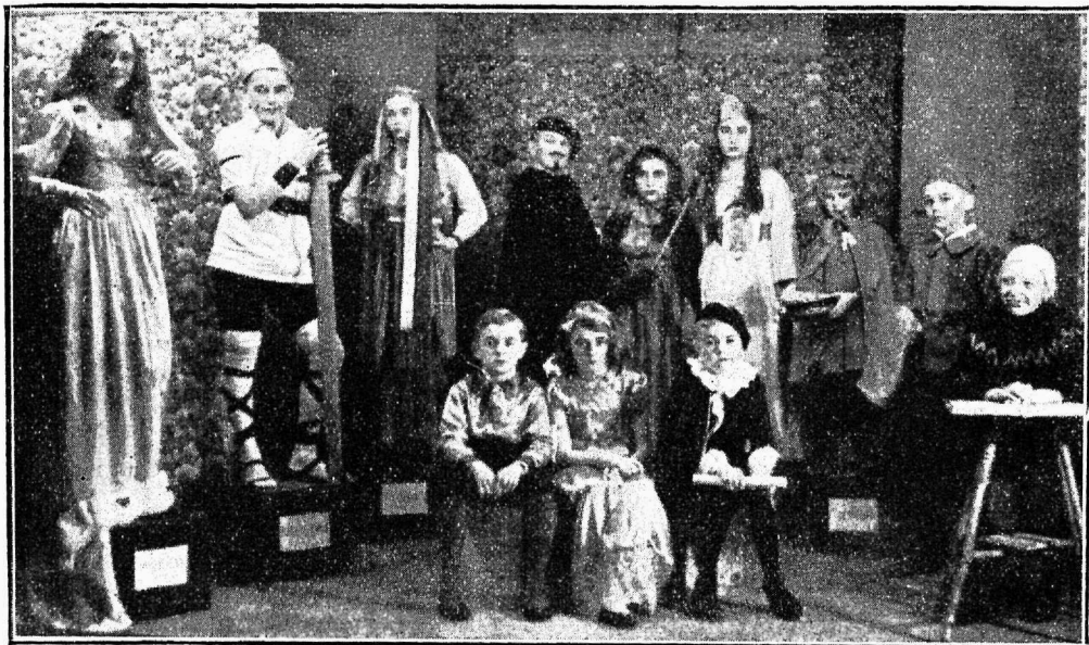
Sydney eesti lapsed näidendis „Nukkude näitus“.