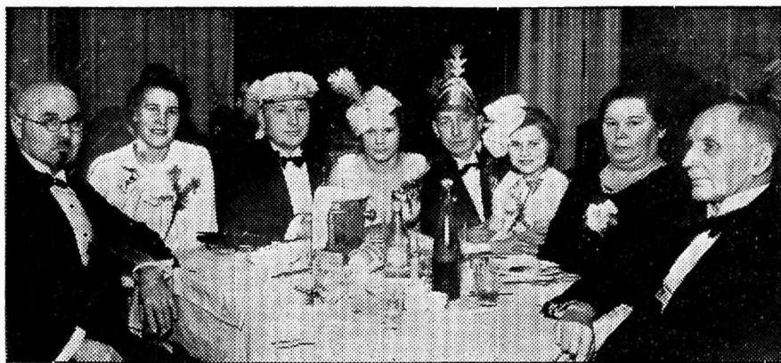
Lõbus laudkond Välis-Eesti ballil, Tallinnas.

Välis-Eesti päeval saabus ühingule õnnitlusi ka Välis-Eesti organisatsioonidelt ja üksikute väliseestlastelt. Telegrammidega tervitasid Pariisi ja Londoni eesti seltsid. Samuti Aluksne eestlased, kes Välis-Eesti päeva pühitsesid õige suurejoone-