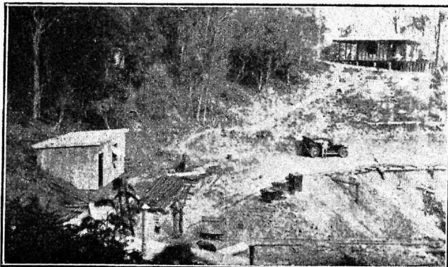
Vaade Cracow'i kullakaevandusele. Osa Golden Plateau tunnelisuust.

Juba aastakümnete eest on Cracow'i ümbruses kulda otsitud, kuid tagajärjelt. 1931. aastal asus neli meest jällegi kulla otsimisele samas augus, kus aasta-