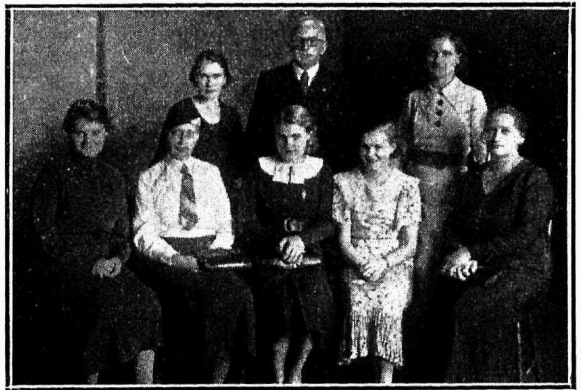
Sydney Eesti Seltsi „Eesti Kodu Linda“ laste edustuskomitee koosseis.

Haridustoimkonna tegevusest kõneles hra J. Blumfeldt. On peetud 6 kõneõhtut, millest võttis osa iga kord keskmiselt üle 60 liikme. Raamatukogu on leidnud elavat kasutamist. Lugejate arv on 49. Raamatukogus on praegu 456 emakeelset, 123 venekeelset, 50 ingliskeelset, 11 esperanto-, 3 prantsus- ja 6 saksakeelset teost. Eestist on juurde tellitud uue- mat eesti kirjandust, mille kohalejõudmist peatselt on oodata.