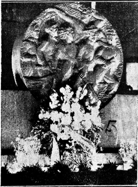
Lilledega ja ilutuledega kaunistatud mälestussammas 1905. a. veresündmuste puhul langenute mälestamiseks Tallinnas, Uuel turul.