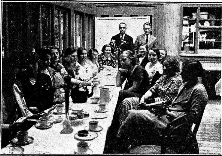
Londoni eestlaste väljasõit Epping-Forest'is 1935. a. suvel.