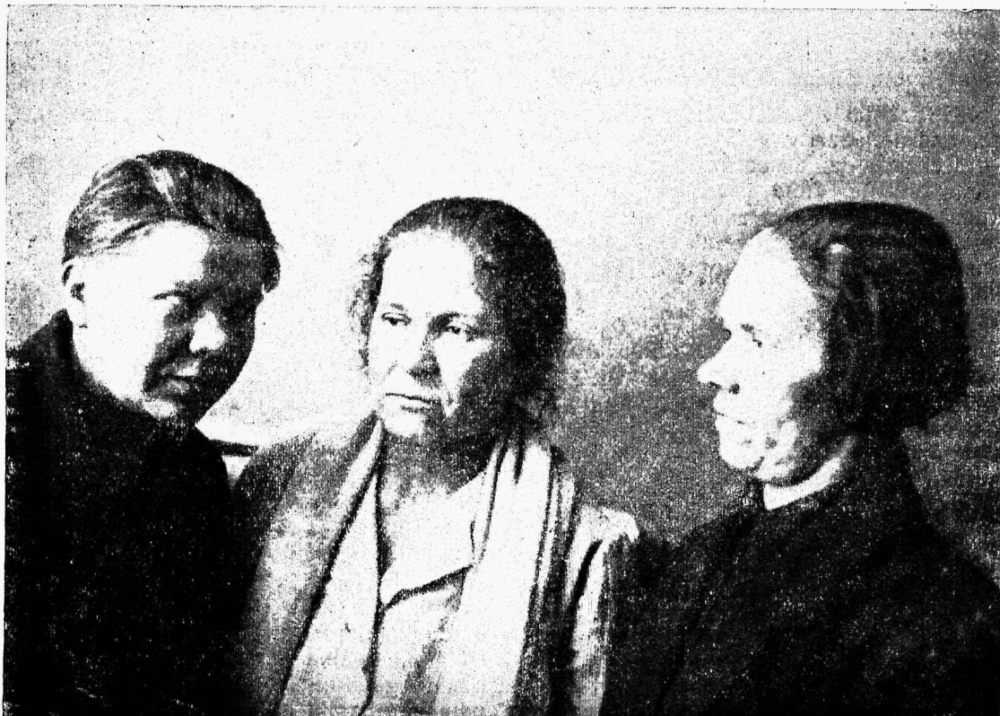
Naiskolhoosnikud Leningradi oblasti IV kongressi presiidiumis.