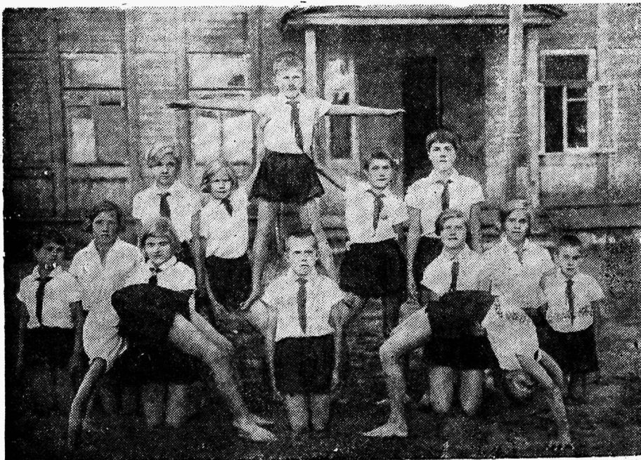
Leningradi eesti lastemaja spordiring.

Lastemaja, — väikene puust ehitus — on seestpoolt kodune ja meeldiv. Uste ja akende ees väljaõmmeldud kardinaid — laste oma käsitöö, niisama ka linate laudadel. Avatud udest, mis viivad magamistuppa, vaatavad vastu lumivalgete patjadega voodid. Lapsed (neid on 52) tunnevad endid täiesti koduselt. Neil on kolm