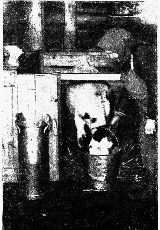
Eeskujulik hoolitsus noorlooma eest.

See nakkus satub majapidamisse kas haigete vasikate või lehmade läbi. Kuid vahest