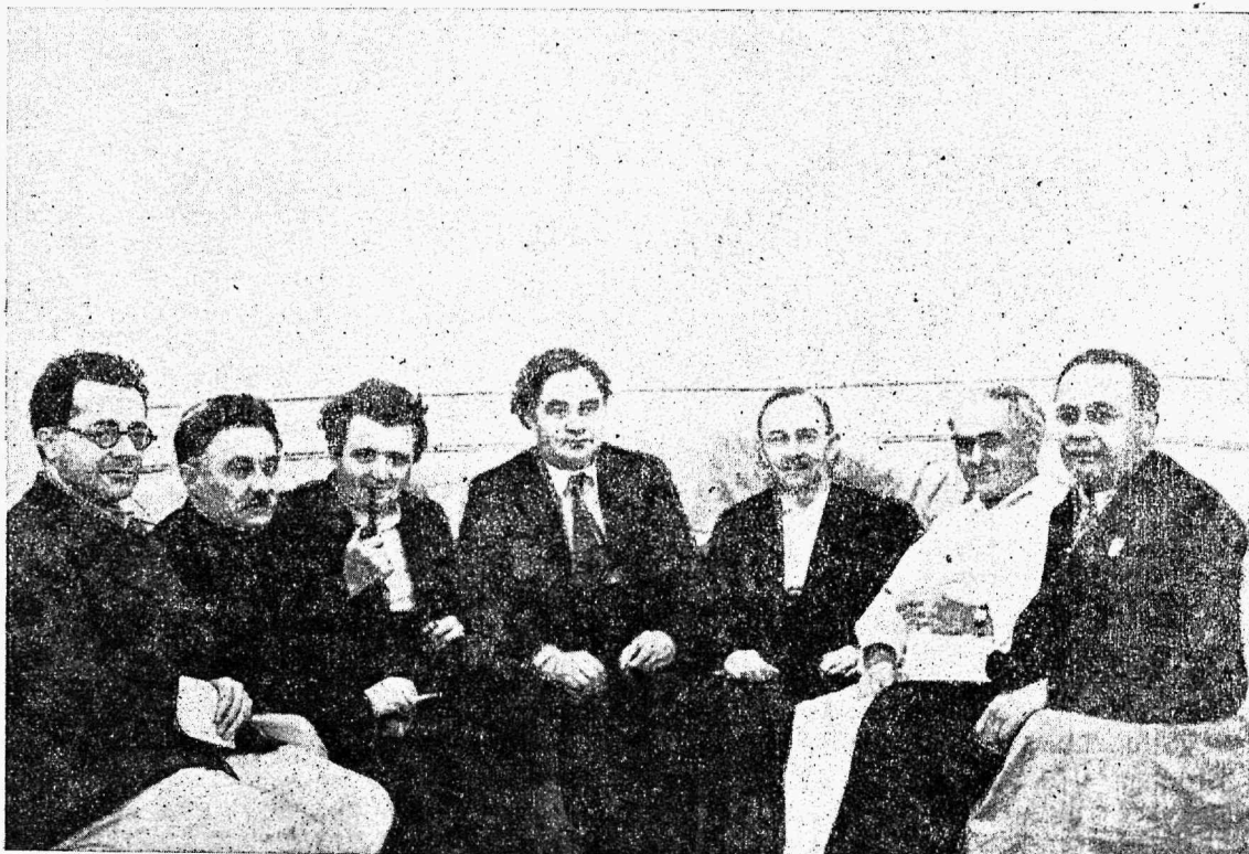
Kominterni täidesaatekomitee sekretariaadi liikmed (vasakult paremale): sm. sm. Erkoli, Manuilski, Gottwald, Dimitrov (peasekretär), Kuusinen, Pieck, Marty.