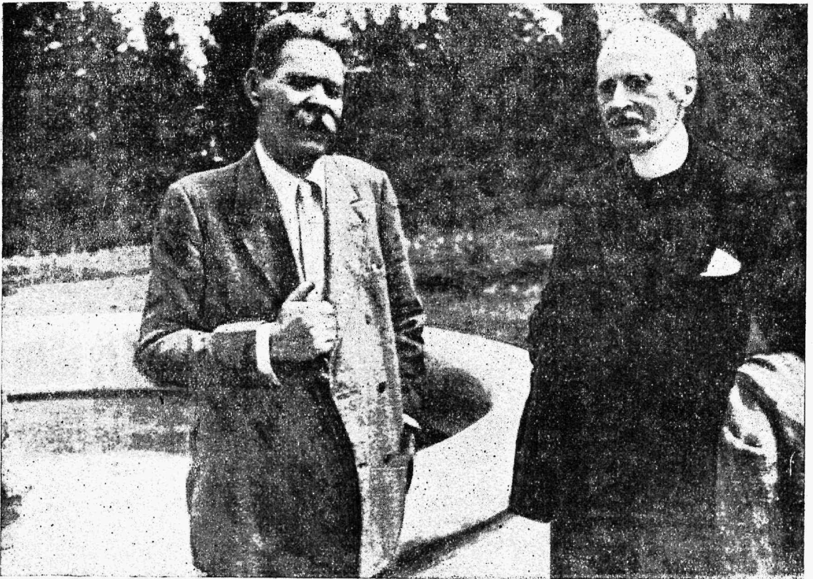
Maksim Gorki ja Romain Rolland.

kuidas, mille eest ja millega vaja naisi peksta. XI sajandil, osariigi-vürstide tülide ajal, kihutasid ka meil mingisugused „nõiad“ (või „targad“) Susdali ja Rostovi maal rahvast naisterahvaste vastu üles, kes olevat nälja esile kutsunud, ja paljud naisterahvad tapeti. Pärast Stepan Rasini mässu kaevati Moskvas elavalt maa sisse mingisugused naisnõiad.