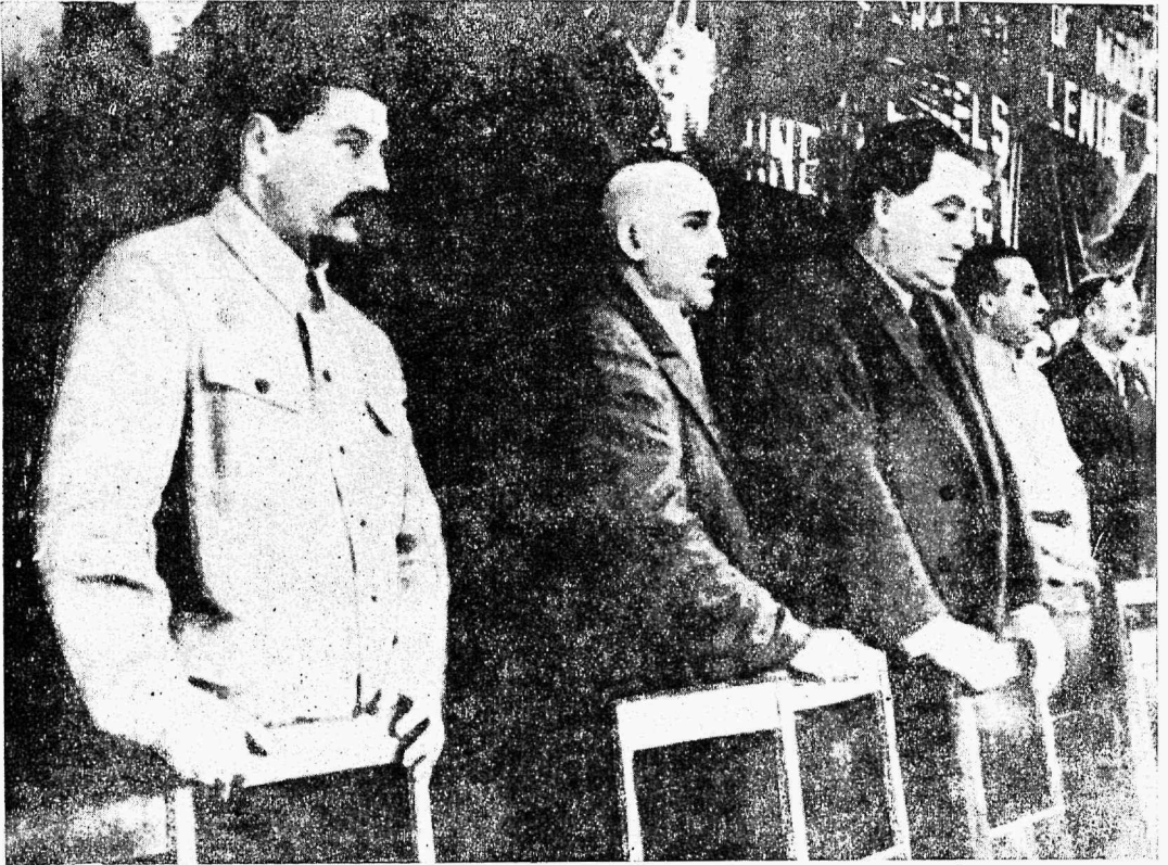
Kominterni VII üleilmse kongressi presiidiumi liikmed: sm. sm. Stalin, Pjatuiski, Dimitrov, Ferdi ja Marty.

„Kommunistid peavad rajama kõige tihedama koostöö nende sotsiaaldemokraatlike tööliste, funktsionääridega ja organisatsioonidega, kes reformistliku poliitika vastu võitlevad ja kommunistliku parteiga ühiseväerinna eest seisavad.“