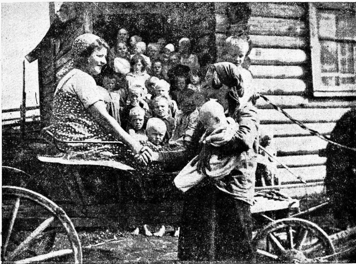
Seltsiline Lifschits kino-inseneride instituudist „Elu“ kolhoosis (Ossipovi külanõukogus) lastesõime tööd järele vaatamas.

torid on, kes partei ja valitsuse otsuste järgi tööd õieti organiseerivad, siis muutuvad kolhoosid enamlikkudeks ja kolhoosnikud jõukateks.