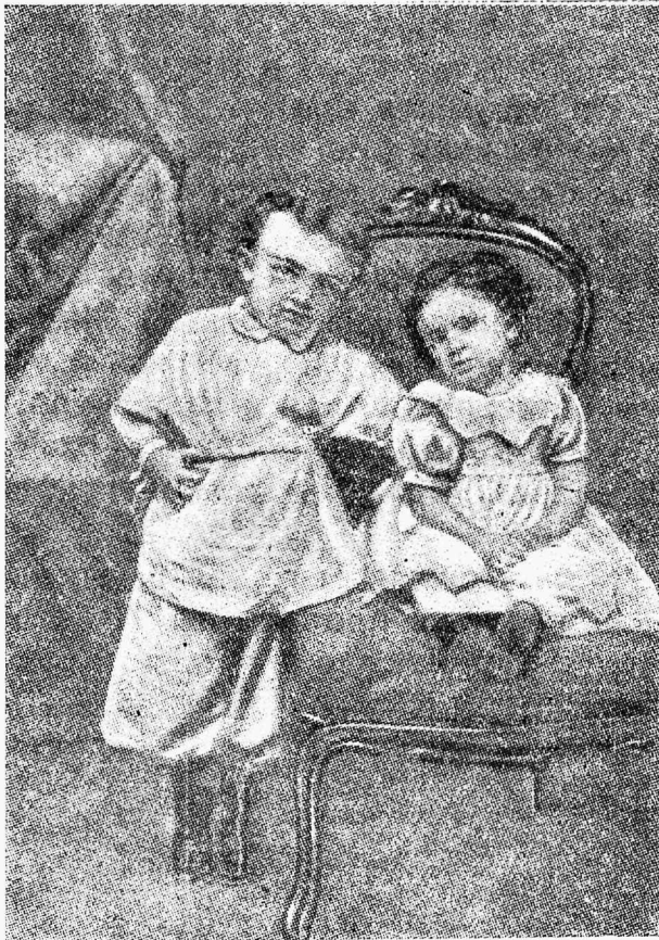
Vladimir Iljitsh oma õe Olga Iljinitshnaga 1874. aastal.

Lenin armastas mitte üksi kõiki lapsi üldse, vaid ta suhtus iseäranis tundelikult lastele, kes olid õigelt teelt kõrvale kal-