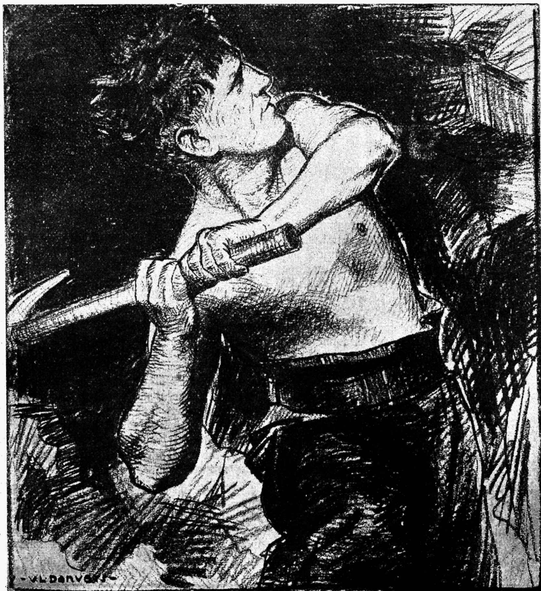
Töeline — kõikide väärtuste looja.

majanduslik vabadus, jee tähendab — majanduslik omavoli. Kapital ja kapitali üündamine peavad jällegi jaama igas juhtes vaba eramajanduse piiramatuks võimulaks. Kus on juba jeatud jisse kontroll, jeal peab jee kohe kaotatama ja kus ettevõteted pole praegusel filmapiigul eraätetes, jeal