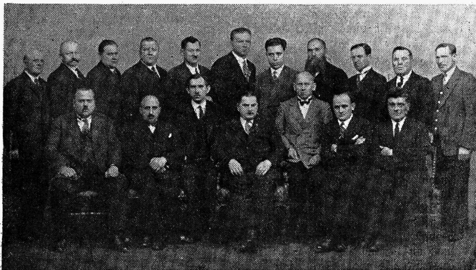
Balti riikide transporttöölise ametiühingute konverentsist osawõtjad.

Konverentsi kokkufutsumise mõte sai alguse l. a. Genfi meretöökongressil