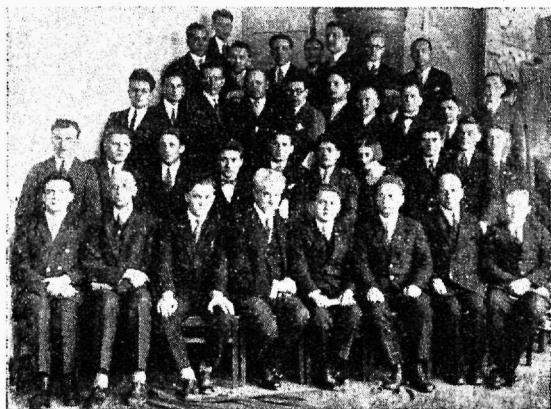
Noorsotsialistliku Liidu II kongressi saadikuid ja külalisi

3) Püüda sidemeid luua organiseerimata töölisnoortega ja neid ühinguisse tõmmata. Tutvustada neid Sotsialistliku Noorsoo-Internatsionaali noorsoo programmiga ja teiste noorsoo kaitseesse puutuvate küsimustega.