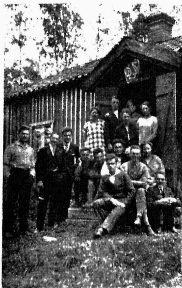
Uppsala (Rootsi) seltsimehed oma suvikodu ees.

Pigem võime küll uskuda, et on puudus „väärtslikest“ põllutöölisist. Ent seda „väärtslikkust“ peame mõistma kogumeestest hallparunite ja „radikaalsete arstide“ retseptide järgi. Siis selgub meile ka see keeruline ja kummaline lugu, kuidas kasvatada põllutöölisi „väärtslikeks“.