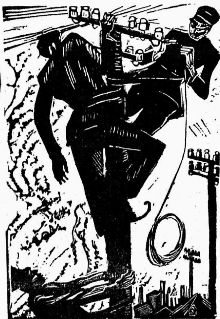
Sella Hasse puulõige.