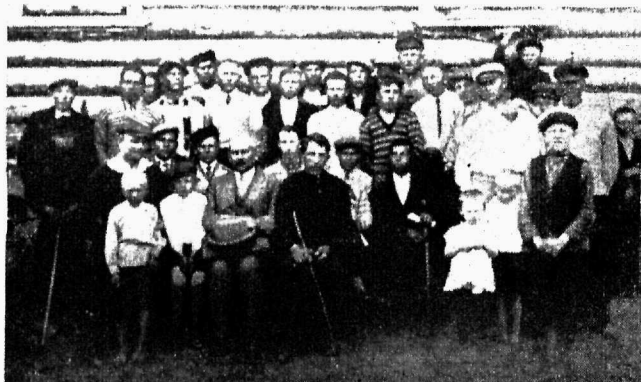
1. Tallinna noorsotsialistid oma traditsioonilisel puhkepäeva jalutuskäigul Piritale.