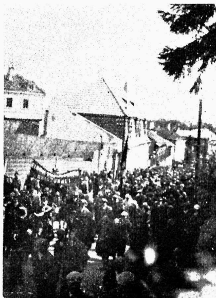
Tartu noorsotsialistid 1. mai rongikäigus. Keskel loosung: Elagu töölistekultuur!