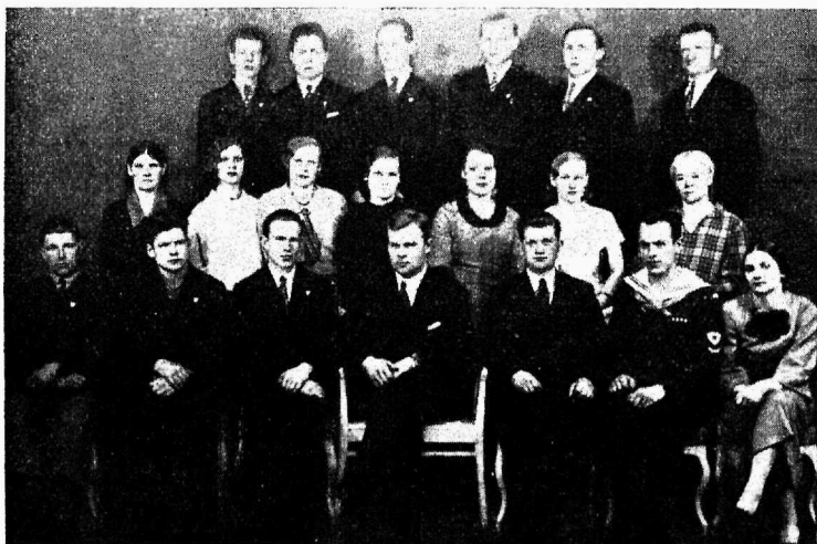
Lõuna-Eesti Kurtummade Selts „Sõpruse“ liikmeskond.

Ühtlasi võetakse sel koosolekul vastu ka seltsi kodukord, milles ettenähtud omavaheliste arusaamatuste lahendajana