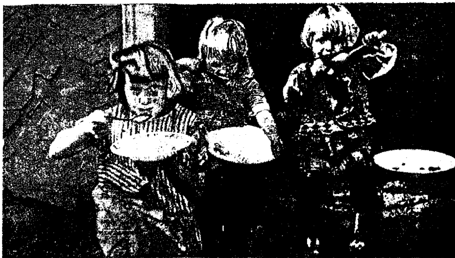
Vaeste inimeste lapsed söömas.

Tegelikult on haigekassad viivitusraha alati võtnud maksu tähtajast arvates selle peale vaatamata, millal nõudmine tööinspektori kaudu algatatud. Viivitusraha on ka siis võetud,