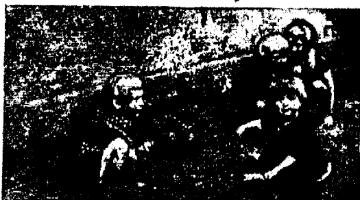
Vaeste inimeste lapsed mustuses ja tolmus mängimas.

ruumid ja aiad jooksmiseks, vaestel lastel ei ole isegi mängukohtagi: nad peavad leppima musta õuenurga ja müüriääriga. On vahe vaese inimeselapse ja jõuka koera vahel.