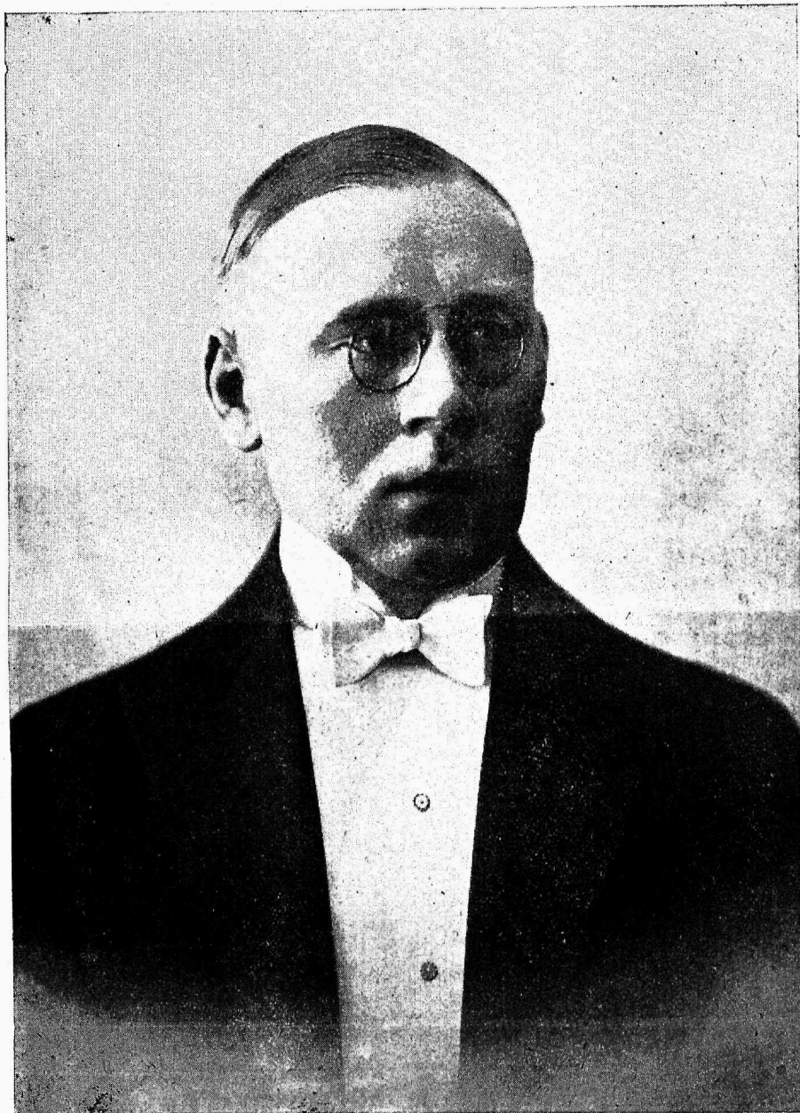
Eesti Vabariigi Riigivanem August R e i.