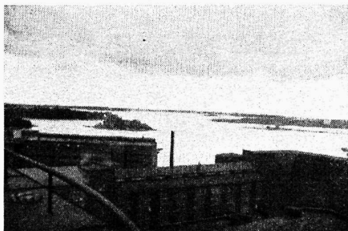
OTK suurkätitsi kontorihoone katusest vaadates

OTK tööstusettevõtteid: riiete-, jahu-, kohvi- jne. tööstused. Sealsamas kõrval on kohe ühistegelise suurettevõtte Elanto peakontor ja tehased. Soome ühistegeline omatööstus on läbi teinud tähelepanud arengu.