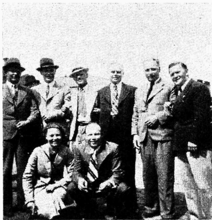
Osa E. A. Koja ekskursioonist osavõtjaid Helsingis

SLTL on viimastel aastatel arenanud oma tegevuse laiemaks kui naaberliidud, millised erinevad SLTL-st oma kutseühingude kaitsmise meetodite ja maailmavaatelise platvormi poolest.