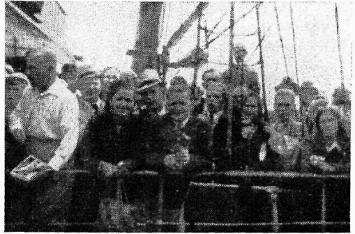
Eraametnike lahkumine Helsingist

Usaldusmees peab olema ka esimeheks vahemeheks töökohal tekkivate arusaamatuste puhul selle eest, et kaasteenijate ja eneste poolt tööjuhtide vahel valitseksid normaalsed suhted.