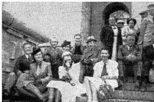
Helsingis parlamendihoone trepil

Kindlustusametnikkudel nõutakse sageli garantiid teatud summa ulatuses. Oma tuttavatelt või sõpradelt saadud kindlustuste vastu saadakse garantii ja võib tekkida olukordi, kus kindlustusametniku sugulase või tuttava talu ähvardab kaotsimineki garantii katteks. Selliseid juhtumeid on küllalt olnud. Neid vealuseid kaljusid, kuhu kindlustusametniku teenistuslaevuke võib pörgata, on palju ja sageli satuvad raskustesse just heatahtlikud ja ausad inimesed, kes teiste hädadele on kaastundlikud. Olles otsekohene, peab sealjuures märkima, pole ülalkirjeldatud töötingimused ka kindlustustegevusele enesele kasulikud. Kui näiteks äsja keskkooli lõpetanu agendi tuttavad lasevad end kindlustada selle teadmiseiga, et nende sugulane või tuttav saab koha ja kui hiljem siiski selgub, et ta kohta ei saanud, siis tekib pettumus ja inimesed võivad isegi kindlustuse katkestada. Kindlustustegevus ise võib selle tõttu sattuda ebastabiilsesse valgusse.