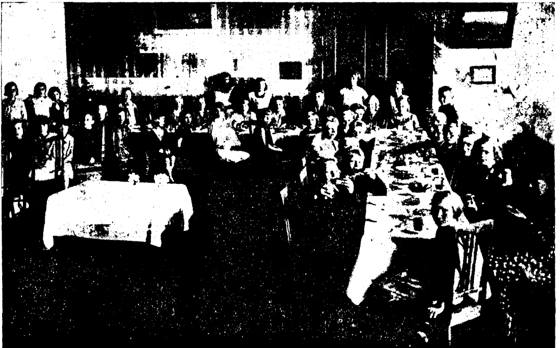
Kunda-Malla algkooli lr. „Noored sepäd“ teelauas lootusringide kevadpühäl 1931. a. (Lootusringlased, õpetajad, võõrad.)