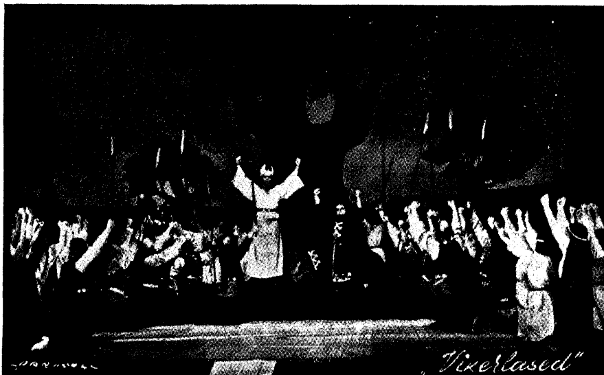
E. Aava ooper „Vikerlased”; hiiestseen teisest pildist.

Võrreldes linnast pärit kooriliikmete ja kõrgema haridusega koorijuhtide hinnangul III astmesse langevaid helindeid, leiame ka nendes mõndagi ühist. Muidugi, oleks väga huvitav vaadelda ka neid motive, mis on mõõduandvad olnud ühe või teise helindi madalamal hinnangul, kuid neid leidub vaid koorijuhtidelt ja on väga erinevad, mispärast nende esiletoomiseks puuduvad ka võimalused.