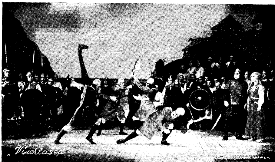
E. Aava ooper „Vikerlased“; sõjatants neljandast pildist.

Väljaspool järjekorda antakse sõna: a) faktiliseks märkuseks, b) korra kohta, c) erakordseks teadaandeks, d) isiklikus asjas ja e) hääletusmotiivide kohta. Faktiliseks märkuseks antakse sõna esimesel kõnevaheajal (s. t. kõneleja lõpetamisel) ühekordselt ja kolmeks minutiks. Faktiline märkus ei tohi sisaldada mingit ettepanekut ega vaidlust. Koosoleku-, päevaja arutluste korra kohta antakse sõna esimesel kõne vaheajal ühekordselt ja kolmeks minutiks. Sel puhul võib esitada