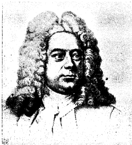
G. F. Händel, kelle sünnist 23. veebruaril möödus 250 aastat.