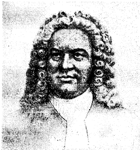
J. S. Bach, kelle sünnist 21. märtsil möödus 250 aastat.

eriline võistlematu koht aga jääb siin Bach'ile kui aegade suurimale meistri-le. Ühiste momentidena mõlema juures võib märkida veel seda, et nad viisid muusikat