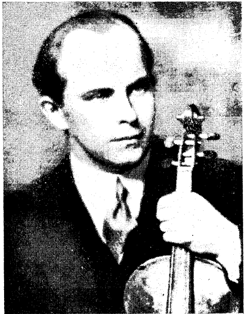
Viiulivirtuoos Vaša Prihoda.