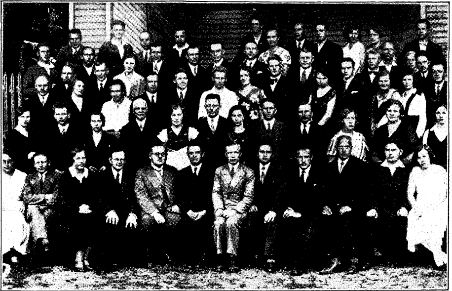
L. L. Tartumaa Osakonna koorijuhtide kursustest osavõtjad

Õige südamlilikuks kujunes kursuse lõpu-