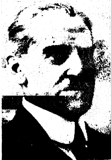
Robert Kajanus 75-aastane

Kuna „Muusikalehe“ piiratud ruum ei luba siin pikemalt peatuda, olgu vähemalt eeltoodud nimestikki „Eestonia“ muusika-dramaatilise töö konsta-teeringuks.