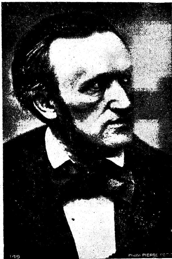
RICHARD WAGNER (1813.—1883.)

Tema ooperi „Lohengrin“ lavastamise puhul „Estonias“.