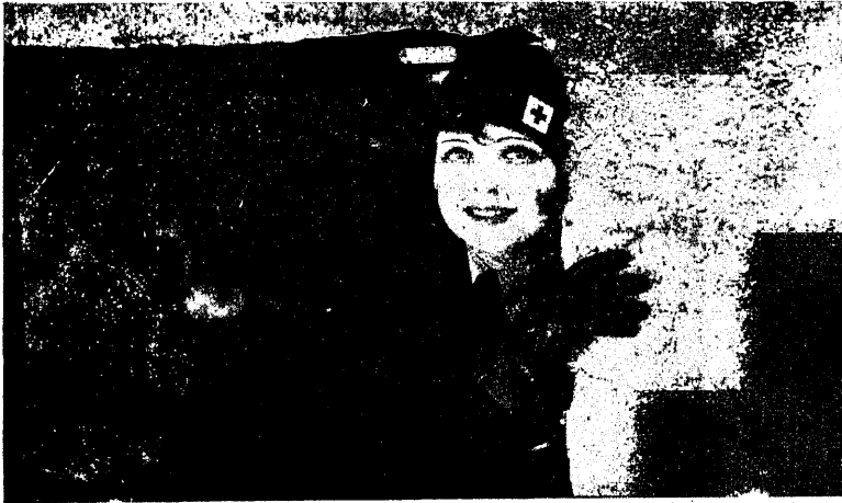
Clara Bow Paramountfilmis „Wings.“

Soovitajad olid vist tema „hääd sõbrad“ . . . Võib-olla oligi nii parem . . . Surnud ei kõnele enam!