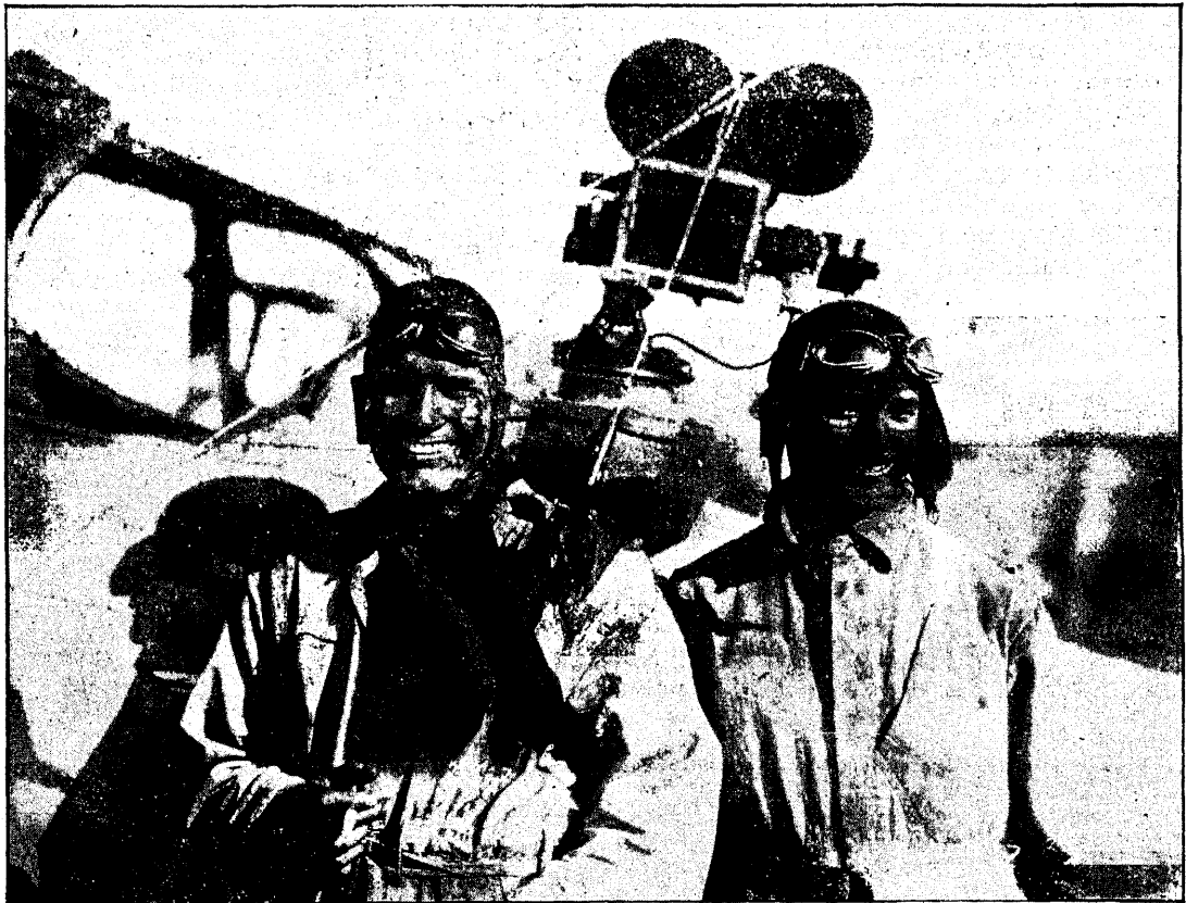
Tahmaste nägudega Richard Arlen ja Charles Rogers Paramount-filmi „Wings“ filmimisel.

teks kujuteldud karistus, häbistus jne. Ka igasugused mõtte- ja jõupingutused on nende põhjuseks. Kui näiteks õkitaja ei suuda rääkida selgesti välja või raskemeelne väljendada oma mõtteid, siis need kortsud on iseloomustavad. Samuti need kortsud tõmbuvad kokku, kui pingutame asjatult mõtteid, et jõuda mingile loogilisele otsusele. Nagu öeldud, võib olla iga toimingu- ja mõtteobjekt vastumeelse tunde põhjuseks. Selle tunde päritolu ja vältus oneneb ka individuaalsusest ja isiku kalduvusest (dispositsioonist), mistõttu ühed ärritavad kiiremini ja kauemini kui teised, vihastuvad kergemini kui teised. Järeldus: kulmudevahelised (otsaesised) püstkortsud osutavad päämiselt halva tuju miimilist ilmet ja kutsutakse esile 1) valu või kannatusega, 2) vihatujus ja 3) pingutava mõtlemisega. Füsioloogiline: Kui näol on kujunenud välja otsaesised püstkortsud, siis nad osutavad, et isik on kannatanud palju või palju pingutanud mõtteid, otsib energiliselt, rahuldamatult probleemide lahendust.