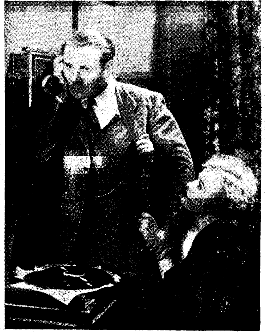
Victor Varconi ja Phyllis Haver filmis „Chicago“.