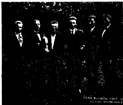
ÜENÜ Aruküla osak. kõleveo meeskond, ÜENÜ juubelpidustuste kõleveo meister.

Pühapäeval, 8 sept. peeti ÜENÜ Aruküla osakonna korraldusel välkturniiri jalgpallis, millest võtsid osa kolm ümbruskonna jalgpalli meeskonda: Aruküla, Raasiku ja Jägala. Esimese paarina kohtasid Jägala ja Raasiku. Võrdlemisi tasavägine mäng, andis viimasele võidu 1:0. Järgnev matsh Raasiku-Aruküla, andis tulemuse 1:0 Raasiku kasuks. Viimase paari Aruküla-Jägala heitlus andis võidu Jägala. Tulemus 2:0 oli Jägala võrdlemisi häa kokkumängu tõttu täiesti teenitud. Turniiri võitjaks tuli seega Jägala, teiseks Raasiku, kuna võistluste korraldaja Aruküla kolmandale kohale suruti.