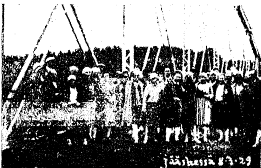
ÜENÜ segakoor esineb Karjala noorte pidustusil.