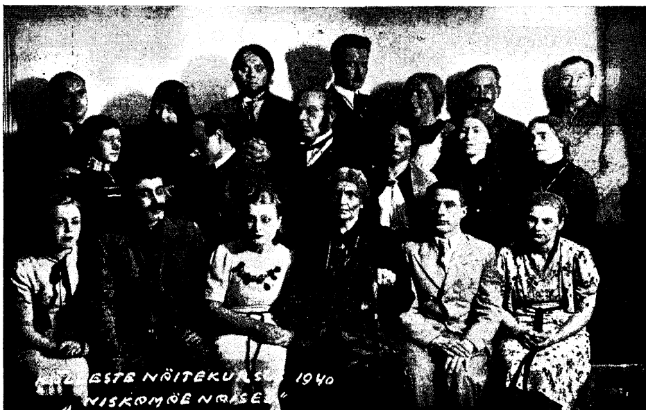
„Niskamäe naised“ Kõllestete näitekunstikursusel. Juhataja H. Sots.

suks nii palju vabatahtlikku endaohverdamist. Paistab, et majanduslikud kaalutlused — sest tahetakse ju tihti peoga hankida organisatsioonile sissetulekut. Tegelik, reaalne arvestus aga näitab, et amatöörteatri näitleja suudab teenida oma töötunnis ainult 1—10 senti*).