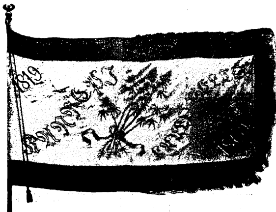
Kanepi Lauluseltsi lipp.

Kommenteerimatagi ülaltoodud tekst kõneleb huvitavat keelt tolleaegse murrangulise