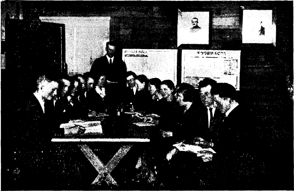
Lääne — Mõisaküla õpiring töökoosolekul.