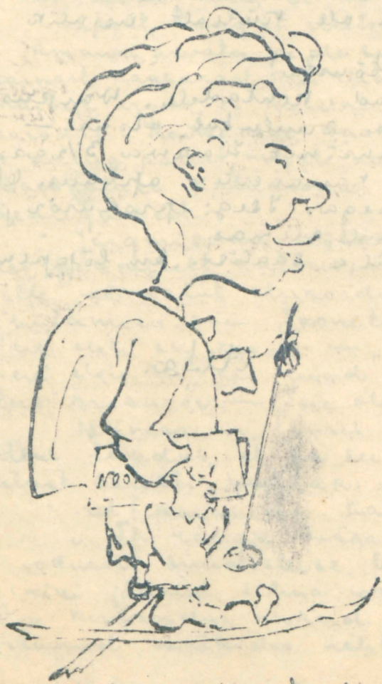
Mis "suurim tegelinski".