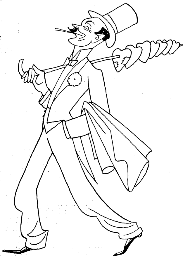
Võidetud südamed. „Uperpall võib ju minu üle nalja helta, kuid fakt jääb faktiks!“