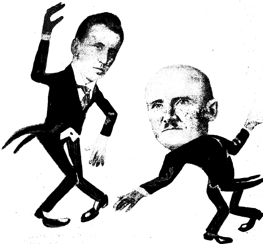
Kaks paremat charlestonitajat ministrite hulgas.