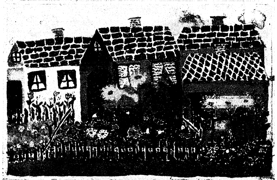
„Meie aed“ (II kl.).