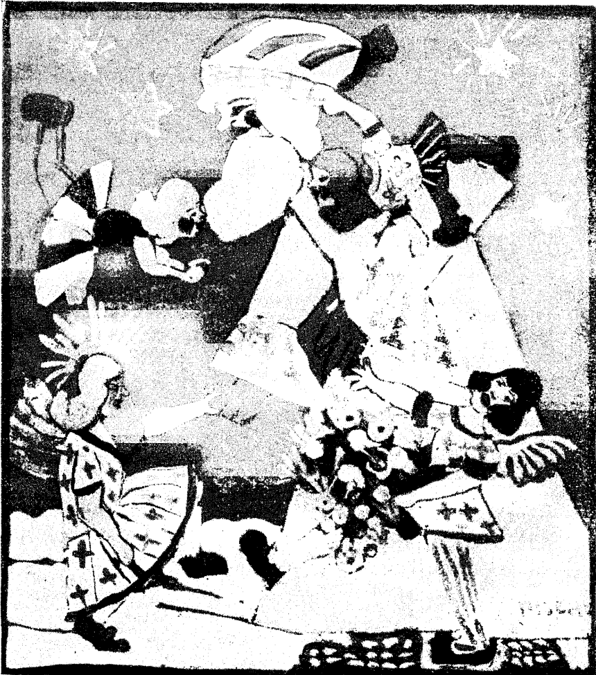
„Jõuluvana“ (IV kl.).

On ju teada, et tegelik töö loob õpilases hoopis teise tunde kui abstraktne asja vaatlus. Tegelik töö juures õpib laps tõelikku objekti tundma ja vastavat materjali käsutama.