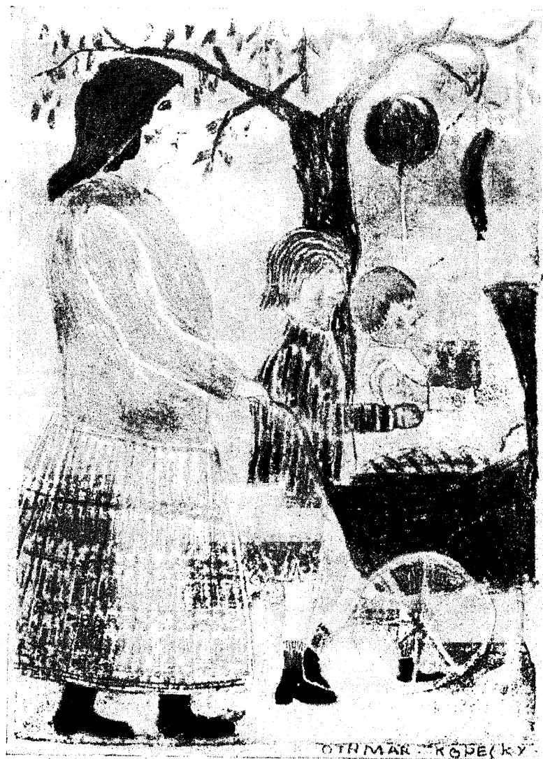
„Jalutamas“ (III kl.).

Vanemais klassides tarvitatakse rohkesti plakatvärve. See on õlivärvi algsamm, kuid hoopis lihtsem. Töö tuleb aga lopsakas ja elav.