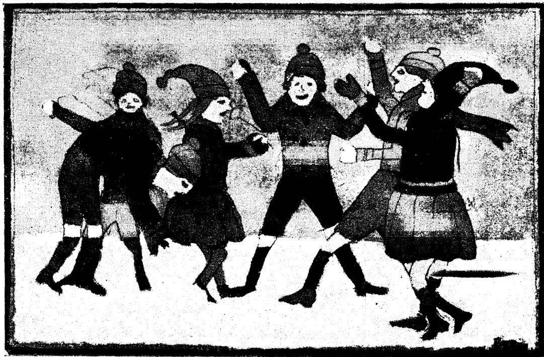
„Lumesõda“ (III kl.).

Kogu õpetus Viinis on tihedalt eluga seotud. Siin püütakse panna alus vaid sellele, mida saab elus kasutada.