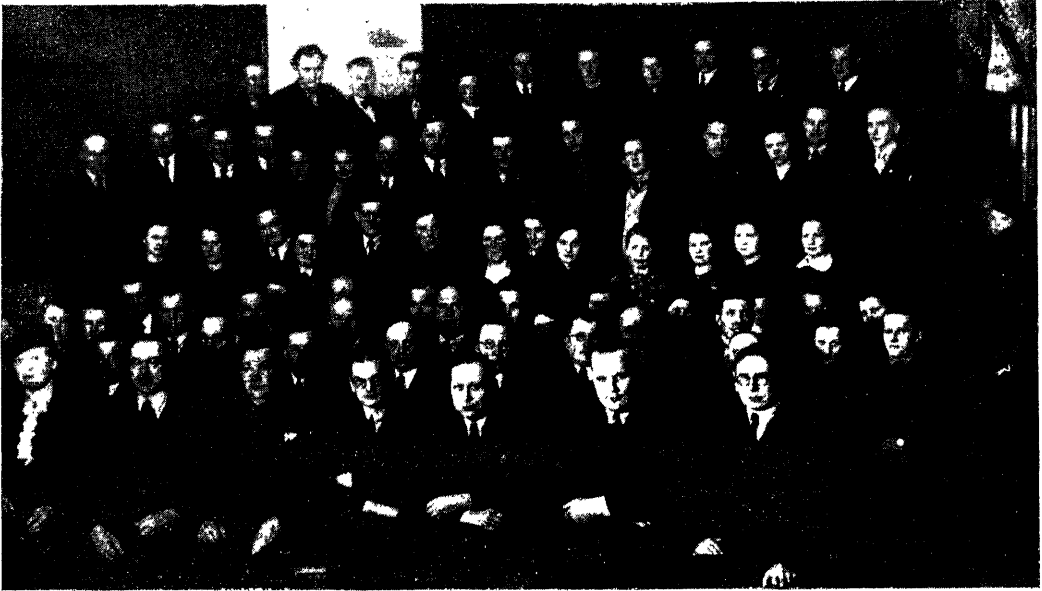
Pildil kaubandusliikudest loengutest osavõtjad Võrus

kõneldes otstarbekohasest lihtraamatupidamisest, kalkulaatsioonist ja ärilisest kirjavahetusest.