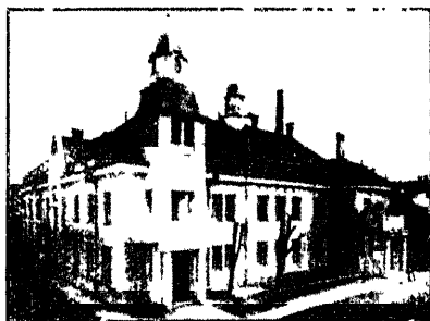
TALLINN, MAAKRI 23 (307-07) RAEKOJA PL. 13 (429-28)

pesuriide- ja kardinakauplus S. Karja 3. Tel. 437-11.