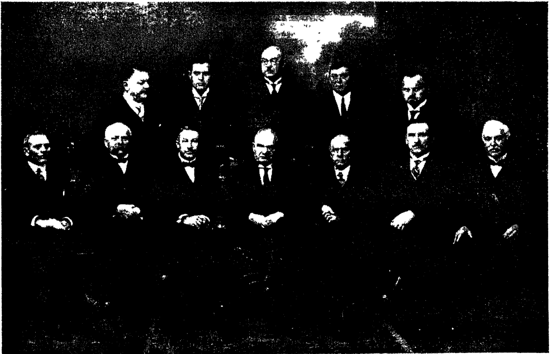
Kaubandus-tööstuskoja senine Nõukogu koosseis.

SISU: Väljavaated kaubanduslikus läbikäimises Ameerikaga. Piimamüügi korraldusest Tallinnas ostja seltsukohast vaadatult. Kadunud miljonid. Ajakirjanikud ringkäigul „Puhk ja Pojad“ suurveskis. Eesti põllumajanduslike masinate inventari kasvamise võimalusi. Kaubandus-tööstuskoja teateid. Kaubandus-tööstuskoja nõukogu koosolekult. Koja I sektiooni üldkoosolek. Majanduslikke teateid kodu- ja välismaalt. Tolliteateid. Äriettevõtete koosolekuid. Unsi seadusi ja määrusi. Turgude ülevaade. Välistöös. Kaubahindu. Tallinna börsi kursisedel.