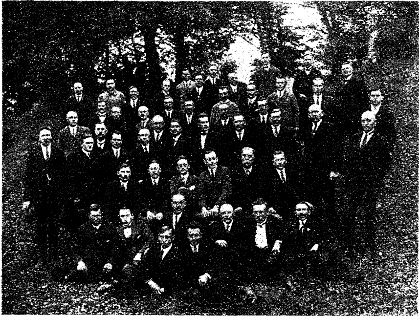
VIII ülemaaline metsateenijate kongress.

Silmas pidades, et riigiasutuste koosseisude ja riigiteenijate palkade seaduse § 5 p. c põhjal on metsateenijatele palgalisana lubatud riigi poolt eluruumid — metsaülemale kuni 5 tuba ühes kõrvalruumidega, abimetsaülemale kuni 4 tuba, metsnikkudele ja metsavahtidele kuni 3 tuba ja asjaajajale kantselei juures eluruum loomuli-