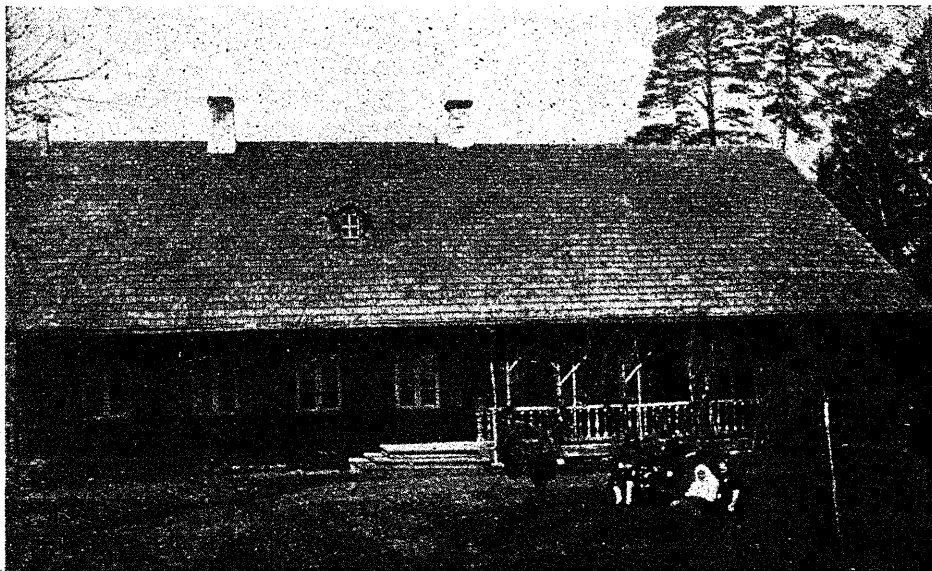
Orava abimetsaülemaja elumaja Kakhva Plotinal (remonteeritud 1926. a.).