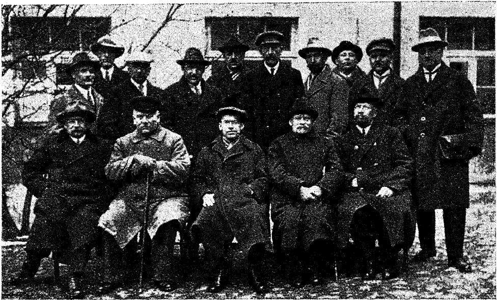
Metsarevidentide koosolek 29. ja 30. aprillil 1927. a.

vahet ei ülemääraliste ega määraliste metsavahtide vahel, vaid kõik jäävad vabapalgalistena edasi teenima, kellega