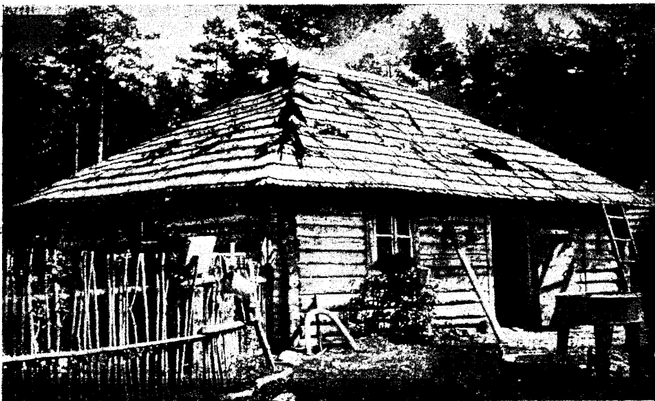
Rõngota metsakõnnu, Laane vahikõnnu metsavahi elumaja.