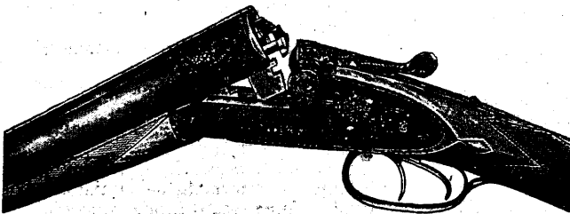
Suhl i. Thür., Saksamaal.

Tallinna Eesti Kirjastus-Ühuse trükituba, Pilt t. 2.