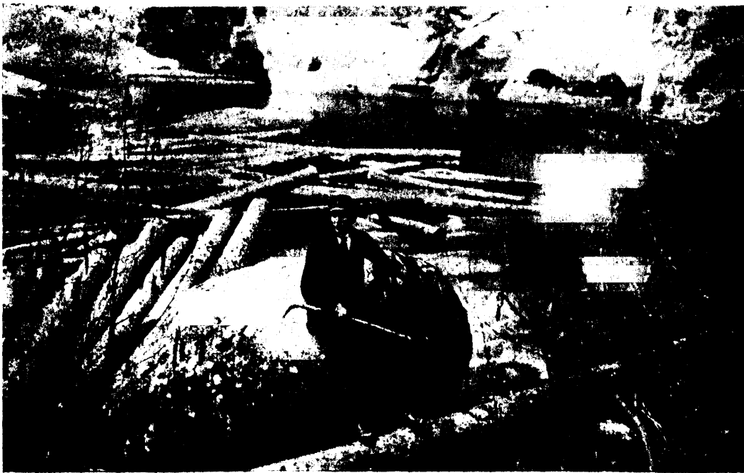
Taevastoja all, Ahja metskonnas.

triiphoone kultuuridest. Viimase tähtsus, seni kui teda ei lõheta, põhjeneb peamiselt õhuliikumise ärakoidmisel ja soojuse kiirgamise vähendamisel; sellejuures talistavad ahtaklaasid aga assimileerumist, mille tõttu osa valguse kiiri kaduma läheb; waatamata selle peale on aga kasvu järelbused palju tagajärjerikkamad kui vabas õhus. Tuule ärakoidmise tõttu jääb soojus, õhuniiskus ja kuumuse ning väetise lagunemisel tekkiv õhuhape kohale; samuti ei ole sunnitud taimed weepuuduse eht mehaaniliste vapustuste