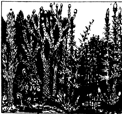
TAIMERIIGI KIWISÖE AJAJÄRG. (umbes 15 miljoni aast tagasi) a) Stigmaria, b) Lepidodendron, c) Arundaria.

Kaugemast minewikust esimese puu sarnane taim kuulub karukõltsete peresse (Lepidodendron), 40 meetrit kõrged, bihtoomilise otste jagunenimisega, pärit arwatawasti juba bewooni ajajärgust (umbes 20 miljoni aastat tagasi).