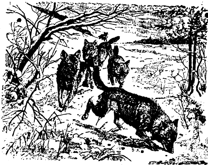
Sundib saati ajamas.

Sunt (Canis lupus) ühes rebasega kuuluvad koerte peresse. Teda on leida kohati üksikult Lääne-Euroopas, Wenemaal ja põhjapoolses