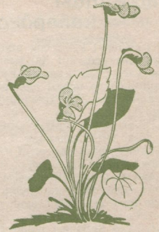
(Alrus 1. veerul.)

vab, „et ta kannab kibuvitsa krooni, kuna ta tegelikult kannab narri mütsi“, nagu väljendab seda Stanly Jones. Narriks muutuud vaimulik näeb ikka vaenlasi oma ümber. Ta vana „mina“ on nii suur ja õrn, et iga väike puudutamise teeb talle haiget. Enda meelest on ta lõpmata palju ohverdanud Jumala riigi pärast, ja teised ei oska ta suurmeelust hinnata. Jeesuse meelest ei ole seal põrmugi jäänud järele. Kõik on lämbunud täispuhutatud „mina“ kullul.