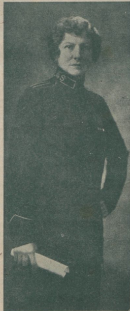
Kindral EVANGELINE BOOTH.

puduloste“ omandajat. Meie et suuda ennem mõista oma õiget su- het maailmale kui siis, kui mõis- tame eelnimetatud fakti ja regu- leerime selle järele kõiki oma plaane ja kalkulatsioone. Meie maailm kuulub Jumalale niipea, kui tunnustame Teda kõigest sü- damest tema omanikuks. Sellest silmapilgust meie saame majapi- dajaiks ja ei pea enam isan-