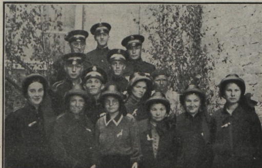
Eesti külalised Soome kongressil.