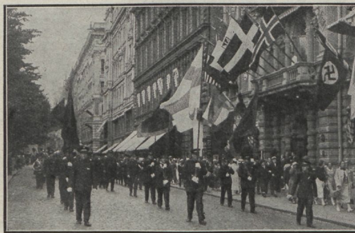
Kongressimarss läbi Helsingi linna.