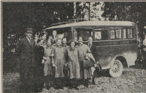
PÄÄSTEARMEE STAABI-LAULKOOK SOOMES teeb sageli välisõjate korpostesse üle maa. Siin on laulukoori liik- med pidüstatust ühel niisugusel laulu- ja muusikareisil.

Kui palju leidub vanemaid, kes jäitavad hoolituse oma kohustused laste vastu. Ärka üles, isa ja ema, enne kui sa pead kahtesema oma hooletust! Tuleta meelde oma vastutust Jumala ees!