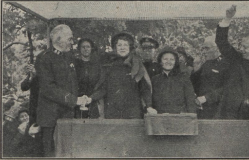
Kindral ülenab kol. Westergaardi kom.-leitnandiks.

Vaimustav vastuvõtt kõikjal Päästearmee kõrgeimale juhile. Aastakongressid Norras, Rootsis ja Soomes. — Suured rahvahulgad koosolekul.