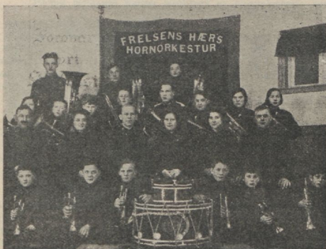
Noorte muusikakoor Islandis.

KÄESOLEVAGA saadan teavitusi kõigile noortele kui ka vanadele sõpradele Eestis meie tööväljal kaugel Põhja-Atlandis ja Norra Ishavetis. Kirjeldan külaskäiku Islandi saartele (Färöarna), mille mina ja mu abikaasa hiljuti ette võtsime. Need saared kuuluvad samuti meie töövälja hulka, ja meil on väga häa korpus Thorshavni linnas. Reis sinna nõuab umbes kaks ööpäeva suurt laevadel, mis liiguvad Köpenhamni ja Islandi vahel. Saared on rohkem lähemal Norrale kui Islandile. Kui sa vaatad kaardile, võid leida väikseid musti laike Atlandi ookeanis, mis tähendavad neid väga huvitavaid saari, mille arv on kaheksateist. Saartel elab umbes 26,000 inimest, kes elatavad endid peamiselt kalastamisest, valaskalapiügist ja lambakasvatusest. See on väga intelligentne rahvas, kes kodukultuuri ja koolihariduse poolest ei jää maha mõnest teisest maast.