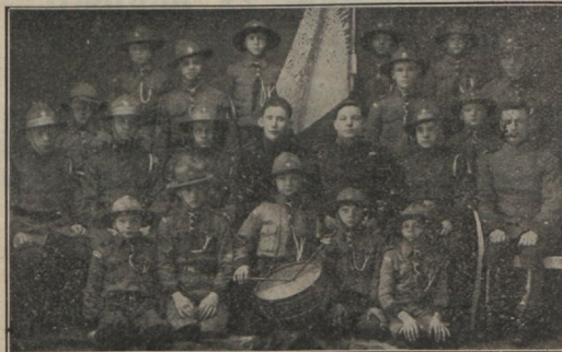
Päästarmee „partiojapat“ Viipuri I korpuses Soomes.

Reykjaviki orkester korraldas rea erilisi koosolekuid Islandis, kus sai paljudele suureks õnnistuseks. Muusikandidid küllastasid ka hulgaid ja mängisid haigetele. Reykjavikis vannutati kuus uut sõdurit. Vabaõhu koosolekuid peetakse järjekindlalt, ka Akureyri's kauges põhjas, ja tuhanded inimesed kuulavad suure huviga Päästarmee sõnumeid. Nende hüüdnõnaks on: „Päästajad Islandis!“