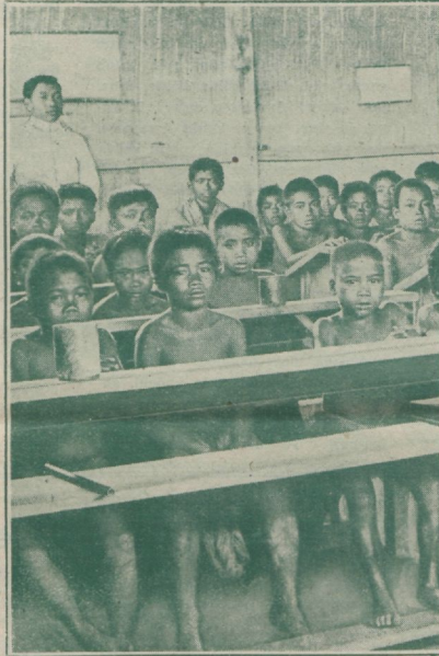
Päästearmee kool Celebis. Kuid siin, nagu näete, istuvad lapsed pinkidel.

Viis kudemistele teises osakonnas tunnistavad, et Koreas maksab veel midagi käitsi kudemine. Nimelt tuleb siingi ikka rohkem esiplaanile masinatöö, kuid kauaks jätkub ka nõudmist käitsi kootud tööde järele.