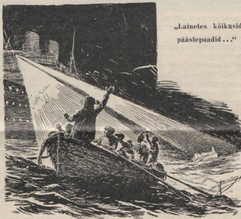
„Lainetes kõikusid päästepaadiid...“

„Tulge minu juure kõik, kes teie vaevatud ja koormatud olete, ja mina tahan teile hingamist saata.“ Kuigi sinu valgus on väike, ära peida seda „vaka alla“. Jumal tahab teha sind selle läbi õnnistuseks teistele. Igavesel hommikul võib näha selgesti, mida Issand on teinud sinu läbi, kui oled annud end tervelt Tema tarvitada.