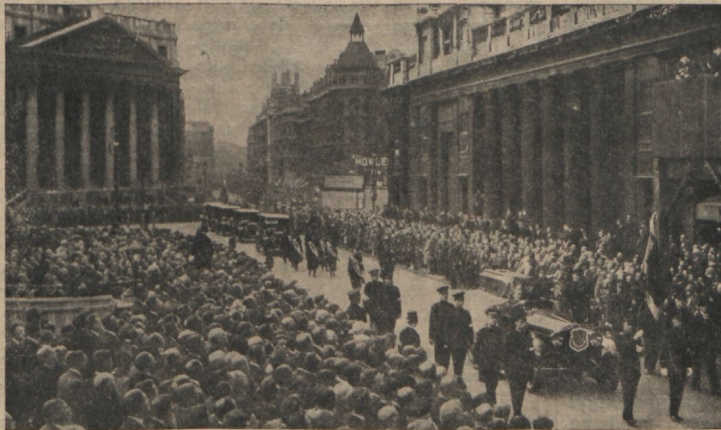
Kindral Bramwell Boothi matuserong läheb läbi Londoni keskaia (tsentrumi).

Surnuaial olid rahvahulgad. Pärast mitme esitaja kõnesid lauldi: „Jumala sulane, hästi teie (Järg 14. lhk.)