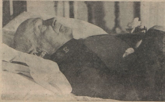
Truu võitleja pani mõõga maha ja läks igavesse rahuusse.