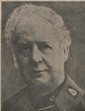
Au sisse tõstetud kindral BRAMWELL BOOTH.

kindral, kuni kord kokku saame ja tervitame üksteist igaviku hommiku tervitusega.“ Komandör Katarina Booth rääkis väga liigutavalt oma isa üle, tema armastusest, millest jätkus kõigile. Tema mõistis rääkida armastuse keelt niihästi platvormilt kui ka üksikute isikutega. Kaheteistkümne aasta vanuselt seisis ta ühenduses maailma pattude ja hädadega,