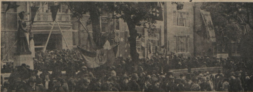
William Boothi mälestussamba — uue kadetikooli — avamisel, mida juhatas prints Georg, Inglise kuninga noorem poeg.