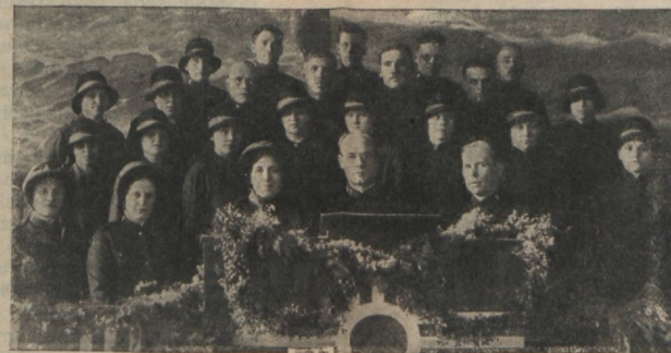
Esimised sõdurid Tallinna I korpuses.