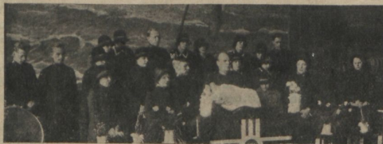
Esimese lapse pühendamise Päästearmee lipu all.

Jutustus sellest, kuidas Iob oli ilma jäänud rikkusest, lastest ja tervisest ja kuidas ta naine viimaks manitses teda sajatada Jumalat ja surra, on öeldud esimestes päättükides Iobi raamatust. Paistis, et kui ta rääkis