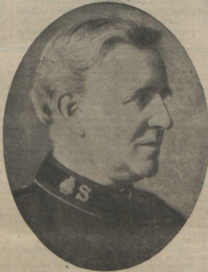
Kindral EDWARD HIGGINS Nüüdne Päästarmee kõrgem juht.

teenistus, nõidus, vaen, riiud, kade viha, vihastamised, riidlemised, lahkumised, segased õpetused, kadedus, tapmised, joomine, prassimine ja mis nende sarnased on, millest ma teile olen öelnud ja ütlen ettegi, et need, kes niisugust teevad, ei pea mitte Jumala riiki pärima. Aga Vaimu vili on armastus, rõõm, rahu, pikk meel, hel-