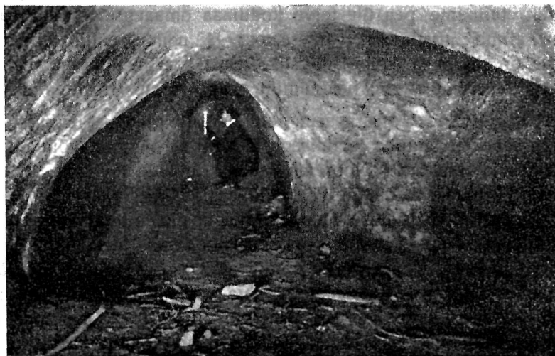
R. Forreri järel.

Pöördudes pelgukoobastikelt tagasi pelgupaigule üldse, võtame veel kord lähemalt vaatlusele nende levimise kodumaal. Nagu mäletame puuduvad praeguses materjalis pea täiesti teated pelgupaigust mitmestki kodumaa osast, näiteks Põhja-Viljandimaalt, Võrumaalt.