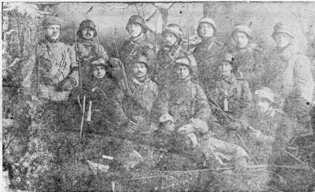
Salkkond Eesti sõdurid nende seas X Mahoni. Langes Opekalni all 1919.

„Mis kasu sest, et koolis käind, Ja sellega suurt waewa näind! Ei selle ametiga ma Küll leiba ei wõi teenida!“