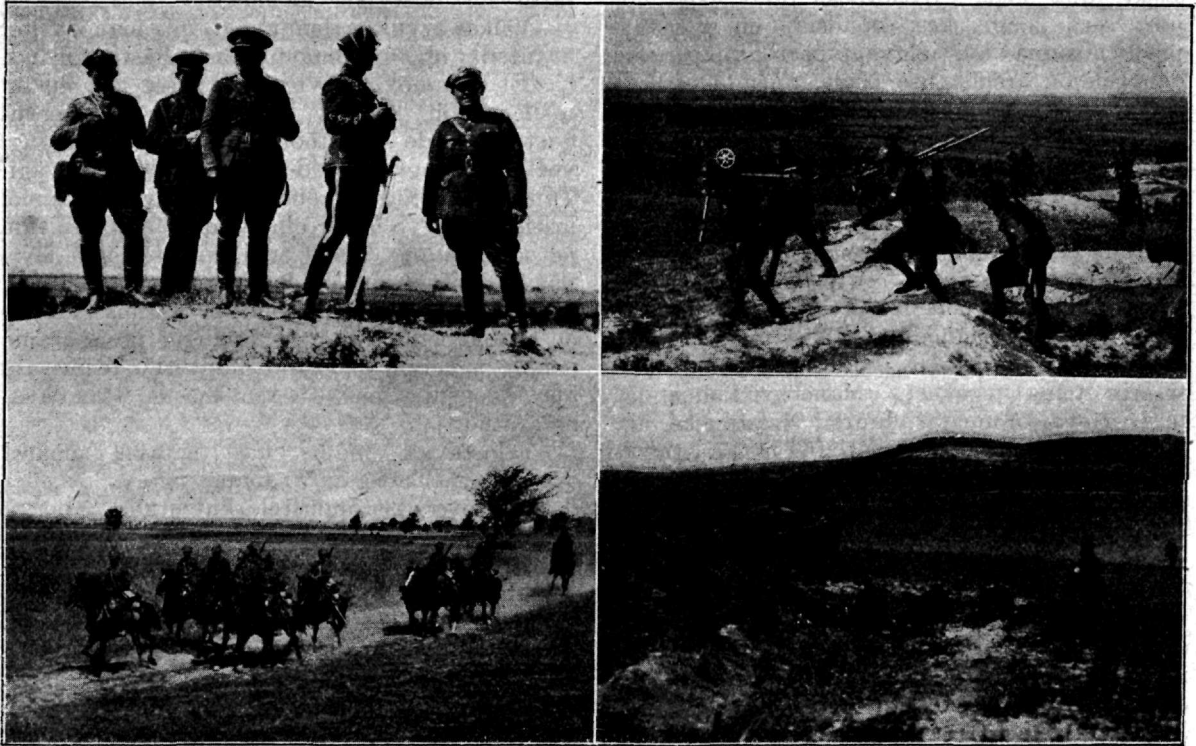
Üksikud episoodid manöövrite tegevusest Wolõõnia maastikul.

Üleval vasakul Eesti sõjaväe esitus manöövritel kindral Tõrvand'iga eesotsas.