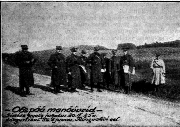
— Otepää manöövrid — Sinise poola juhatus 20. II. 25 a. kõrguslikul 30.5 juures, Rõngu alal eel.