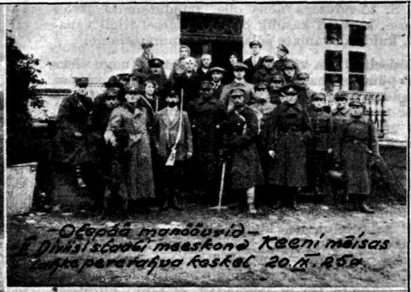
— Otepää manöövrid — Diviisitaadi maastond Keeni mäislas juhatuse paratavalt kaskel 20. II. 25 a.