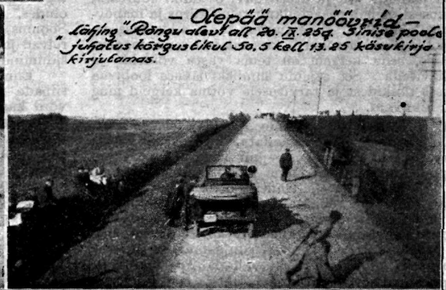
— Otepää manöövrid — Laifing "Rõngu alal" 20. II. 25 a. Sinise poola juhatus kõrguslikul 30.5 kell 13.25 kaksikirja kirjutamas.