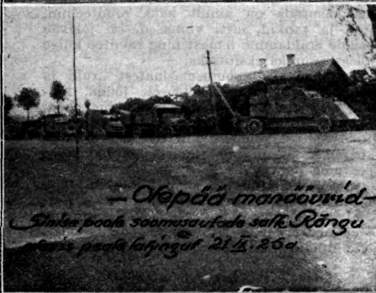
— Otepää manöövrid — Sinise poola soomusautode salk Rõngu alal pealaifingul 21. II. 25 a.