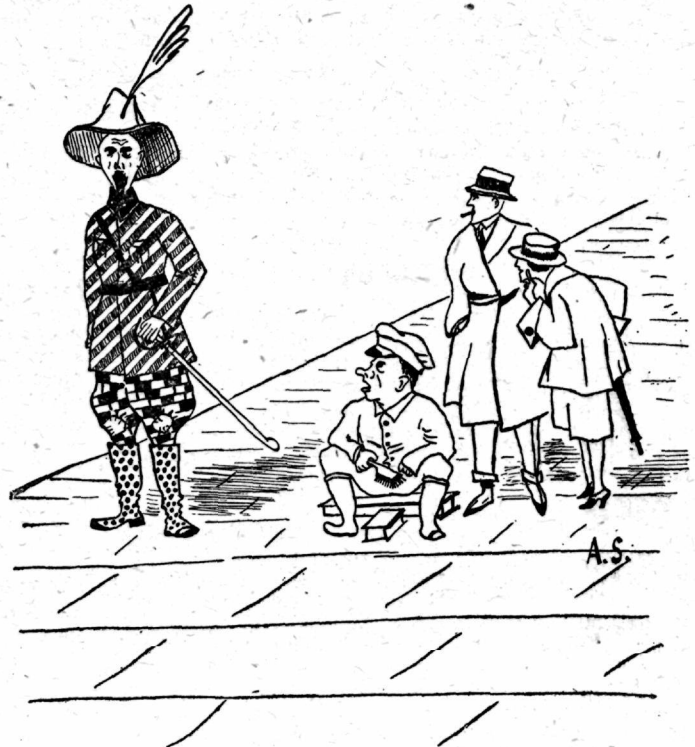
Vabariigi ohvitser tänaval K. poolt soojalt soovitatud uues siiru-virulises „mundris“.

kord järele, mida ütlesid väeosad, kui hiljuti järele küsiti arvamisi vormi muutmise kohta — soovid on veel kirjumad kui K. poolt soovitatud kirju-lapiline-siiruviruline ülirikond ühes kaabuga. No kuidas saab siin igapäev tahtmist täita? On kindel, et missuguse vormi meie ka ei teeks, ikka leidub neid, kes pole rahuldud. Sellepärast tuleks