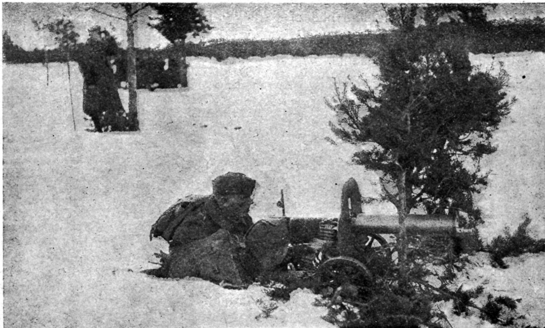
Sõjawäe Ühendatud Õpeasutuste allohwitseride pataljoni kuulipildurite kompanii teeb kuulipildujast kaugetulistuse harjutusi kaardi järele.