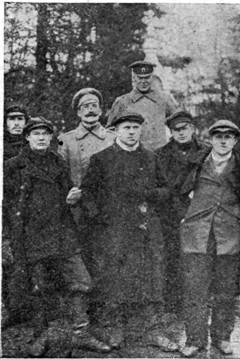
1. Eesti rügemendi ohwitserid ja sõdurid, kel korda läks ümberrietatult teel Kuresaarde sakslaste käest põgeneda.

Jäi üle mehi Rohukülas jälle maha laadima hakata. Üks juba reidile sõitnud weolaew pööras ka sadamasse tagasi. Kõik see mõjus meeolusse rusuwalt. Päälegi olid teadmata sakslaste ligemad kawatused. Wõis oletada dessandi wõimalust mandrile ning tuli walmis olla kõige halwema wastu. Wenelased mõtlesid ainult põgenemise pääle. Muu seas kipitas neil weel südame pääl Rohuküla sõjasadama õhkulaskmine ega püsinud mehed kuidagi oodata, kuni 1. rügement wäljalaaditud ja sadamasillalt lahkunud, waid käisid aga