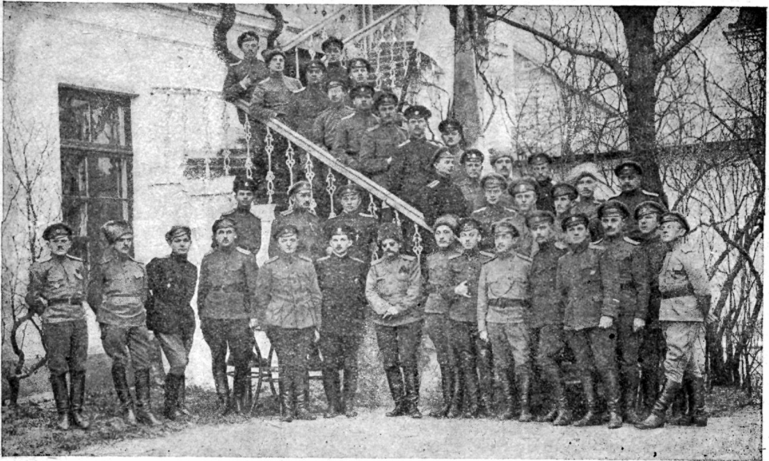
I. Eesti rügemendi ohwitserid 1917 a. lõpul Haapsalus.

Meeleolu muutus äärmiselt pinewaks. Kardeti tõsiselt iga silmapilk awalikke kokkupõrkeid. Lõpulik otsus olenes muidugi Petrogradist. Ka sääl puhusid teised tuuled. Riigi tüüril oli paendlik Kerenski, kes Sold.-Tööl. Nõukogu otsustega arwestas. Toetamisest polnud juba sellepärast enam juttugi, küll aga katsuti takistusi iga wiisi teele weeretada. Päälegi oli Wene walitsus waheajal rahwusliste wäeosade asjus täitsa eitawale seisukohale asunud, milleks wist omajagu põhjust andis ka Ukraina rahwusliste wäeosade asutamise püüd, mis just parajasti laineid löi. Kulus enne palju waewa, kui wiimaks Kerenski 7. mail