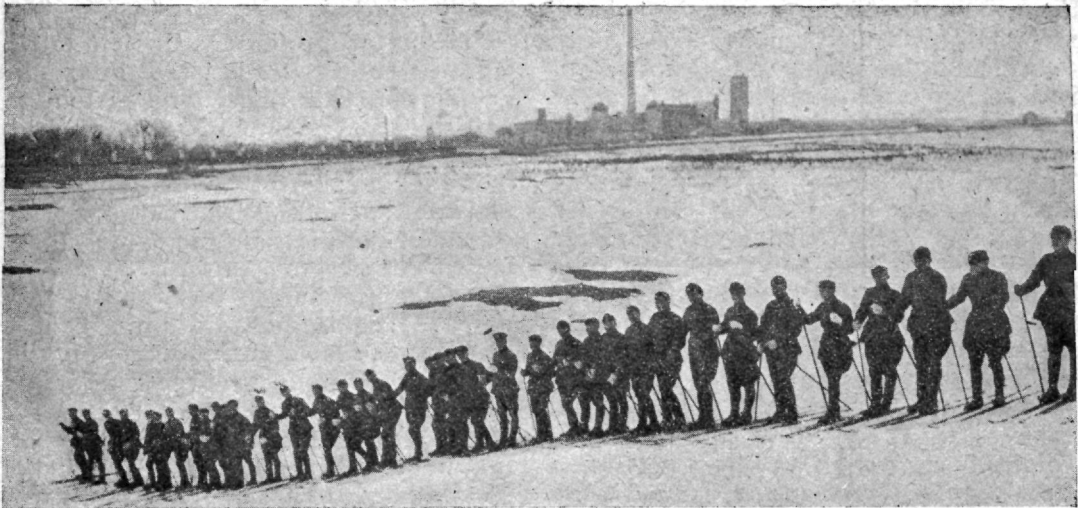
Sw. Üh. Öpeasutuste allohwitseride pataljon Ülemiste iärwe ääres suusaharjutustel.

oma eeskujuga teisi ergutama. Maastik tegewuse raionis oli enam-wähem hästi tundma õpitud, side tankide ja jalgwäe wahel loodud ja tankide toitmine organiseeritud.