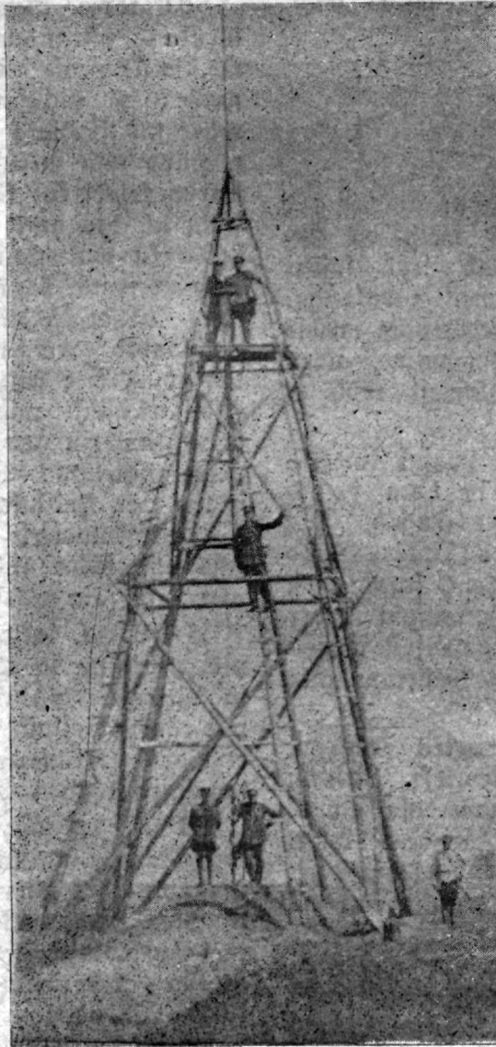
Piirikäänu raud post ja selle kohal ehitatud triangulatsiooni signaal Schaehnitsa küla juures, Isborski raioonis. Üleswõetud 19. augustil 1920. aastal.