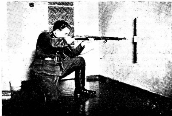
Kõrge põlvelt-laskmise põhiasend sihtimise harjutamiseks nõelaparaadiga

Et meil ei oleks vaja sageli vahetada märklehte, selleks võime kasutada ühe ja sama sihtpunkti pihta sihtimisel mitmesuguseid sihiku seadeid.