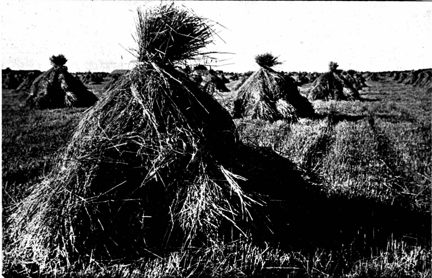
Juba ilutsevad rukkihakid väljal ja ootavad masindamist

saanud ta jätta avaldamata korrapidajate politseinike suhtes, kes rahvarändamise ajal seisid nii korralikena, nagu ei oleks neil üldse tegemist tuhandetega. Üks inglise kõrgem kirikuõpetaja seisid rohkem kui pool tundi pärast laulupeo lõppu näitusväljaku kohal ja jälgis, kuidas liiklemist juhiti politsei poolt „nii osavalt, delikaatselt ja sümpaatselt, et mine või suru nende kätt ülisma eeskujule.“