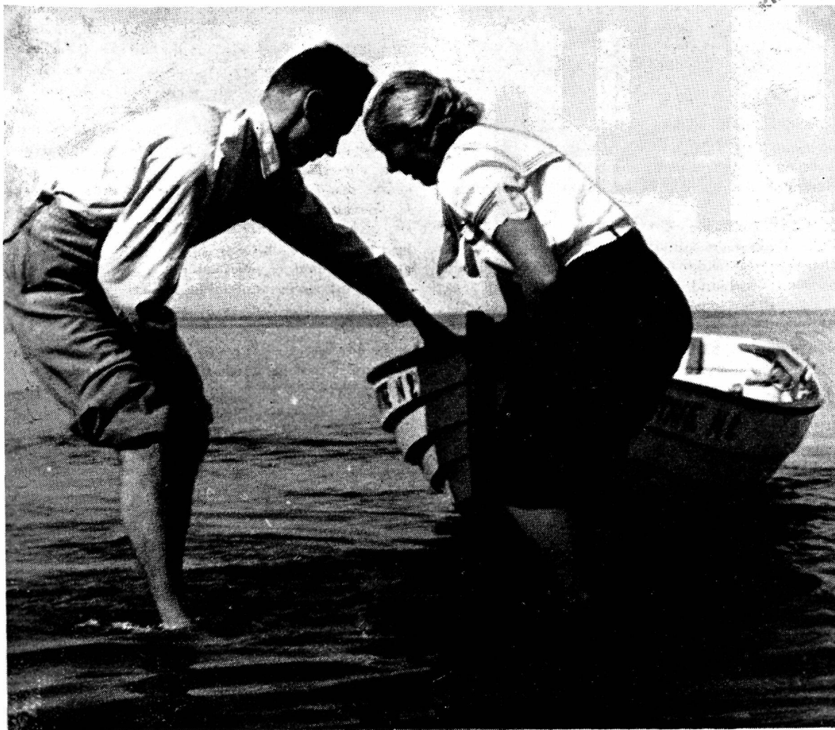
Pärast väsitavat sõitu