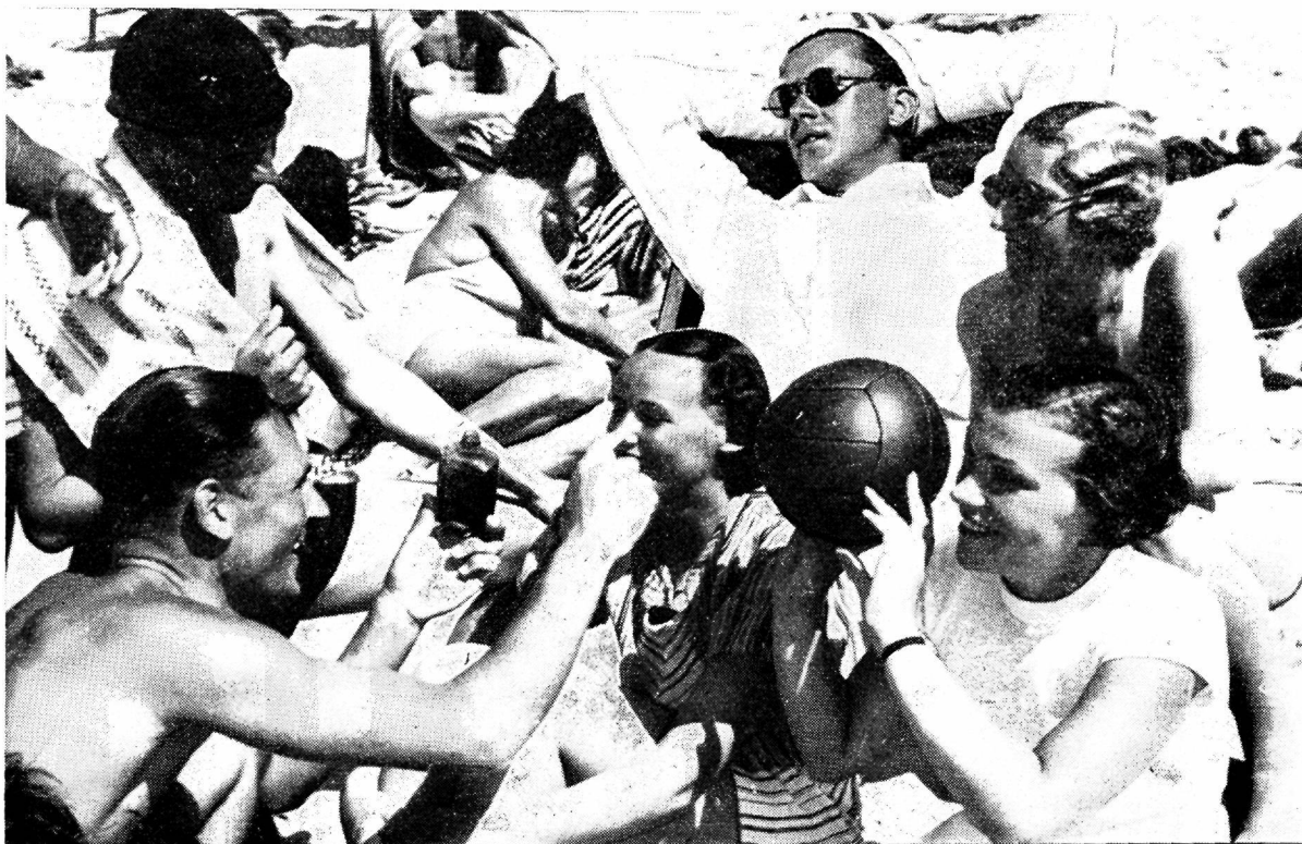
Pildimontaaž Narva-Jõesuu suvitajaist

On selge, et esialgse vaatluse toimimisel, eriti juhtumel, kui sel ajal puuduvad igasugused andmed süüteo toimijast, vahest ka toimimismotivideist, jääb mõnigi asi tähele panemata. Hiljem selguvad ühed kui teised asjaolud, mis ühenduses teopaigaga, ja need juhivad sinna tagasi. Need võivad tekkida tunnistajate kui ka kahtlusaluste ülekuulamisele, ja siis on asja huvides paratamatu vajadus minna teopaigale tagasi, kontrollida seal asjaosaliste seletuste selgitamiseks, kas selliseid asjaolusid seal on tegelikult, missugused need on ning otsida seega sealt tõendeid nende seletuste kinnitamiseks või ümberfukkamiseks. Võidakse väita, et tunnistajate ja kahtlusaluste seletuste kontrollimine teopaigal ja selle ümbruskonnas ei anna tulemusi, sest kui inimene on mõelnud välja mingi loo, siis on ta selleks ka