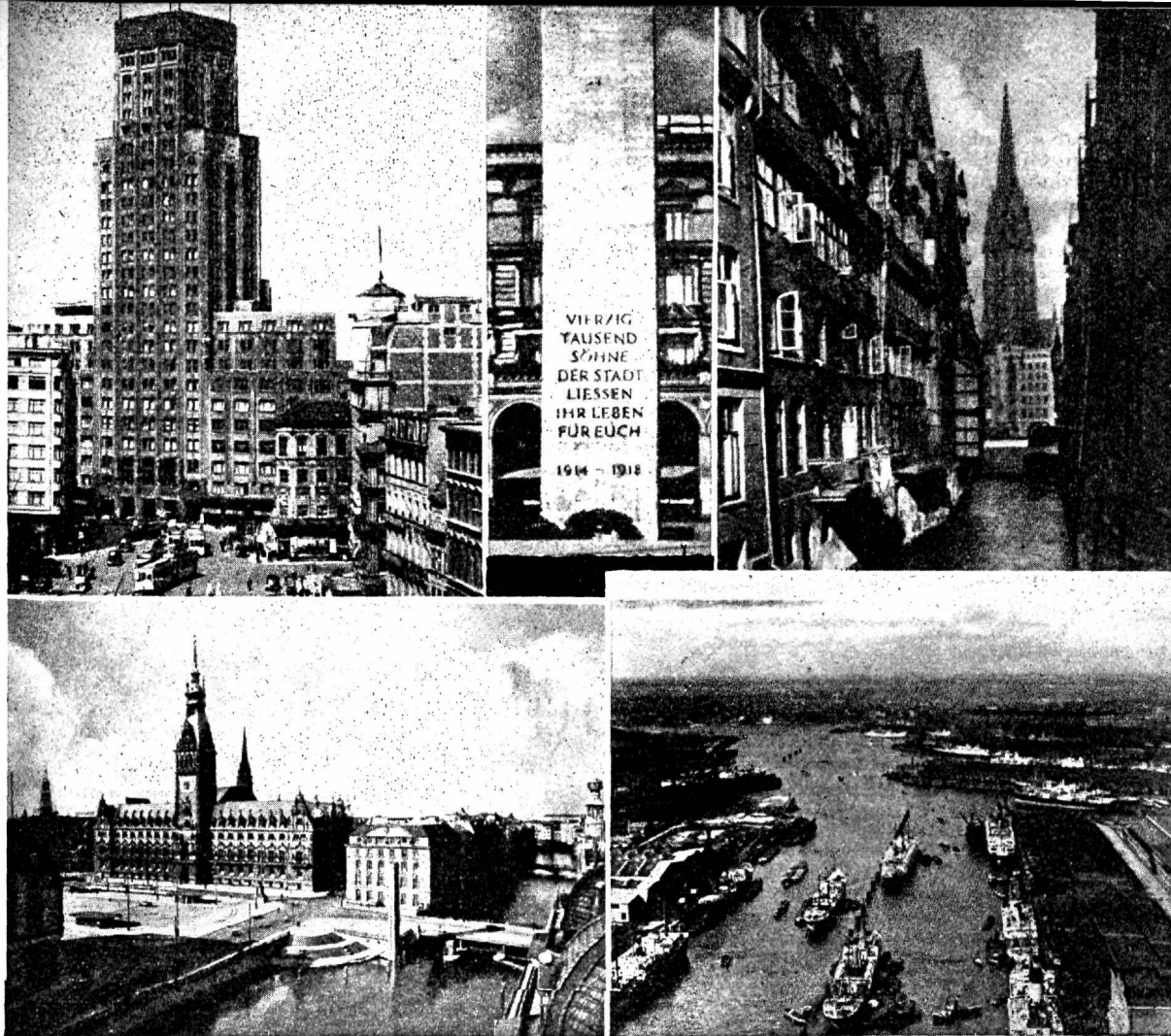
Ülal va s a k u l: Toreengebouw — Antverpeni moodseim ja suurim pilvelõhkuja, 24 korda ja 87,5 mtr kõrge. Paremäl pool näha maja, kus asub Eesti peakonsulaat. Ülal keskel: „40.000 selle linna poega jätsid oma elu teie pärast 1914—1918“ — maailmasõja mälestussammas Hamburgis. Ülal p a r e m a l: Vana-Hamburgi tüüpilisemaid kanaleid — Steckelhornflet ja St. Nikolai kirik. All va s a k u l: Hitleri plats Hamburgis. Keskkel hansaajal ehitatud raekoda, maailmasõja monument. All p a r e m a l: Vaade Euroopa mandri suurimale sadamale — Hamburgile.

tiliseks küsimuseks on kujunenud võitlus kahe keele üheõiguse eest. Flaame, kellele keel on hollandi keelele umbes samalähedane nagu meie põhjamurre lõunamurdele, on 60 protsenti. Valloone, kes räägivad prantsuse keelt ja kes seni on valitsenud, on ainult 40 protsenti. Nüüd on üheõiguse seadused küll antud, kuid ühed ei taha vanast olukorrast mõistlikult loobuda ja teised on sageli liiaks käredate kiirustama.