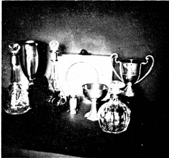
„Dagi II“ võidetud auhinnad

15. juulil s. a. oli Haapsalu Jahtklubi poolt korraldatud rahvusvaheline võidusõit Haapsalu lähel, millest Dagi II ka osa võttis. Startis 15 jahti. See oli põnev ja närvekõditav sõit, kuna Dagi II tahtis võitjana jätkata esirinnas sammumist ja auhindade noppimist. Dagi II start