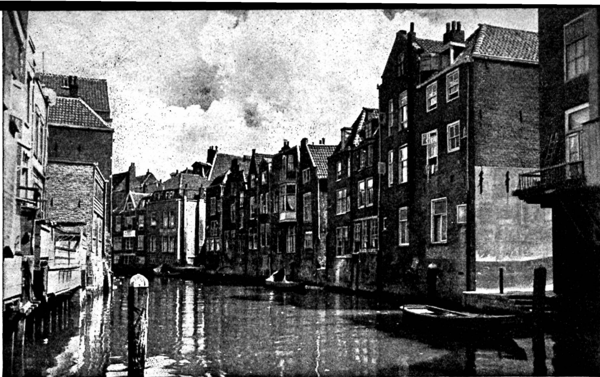
Hollandi Veneetsia — tüüpilisemaid kanaleid Dordrechtis, Hollandi vanimas linnas. Selliseid kanaleid on väga rohkesti ka Amsterdamis, Rotterdamis ja Belgia suursadamas Antverpenis