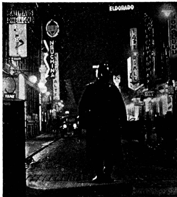
Korralvalvur „moodses Baabelis“ — Hamburgi lõbustuskohtade linnaosa St. Pauli peatänavas Reeperbahnil

Iga matkaja võiks neist elamusist kirjutada pööbõpaksuseft. Ometi reisikirjale leitud kitsas