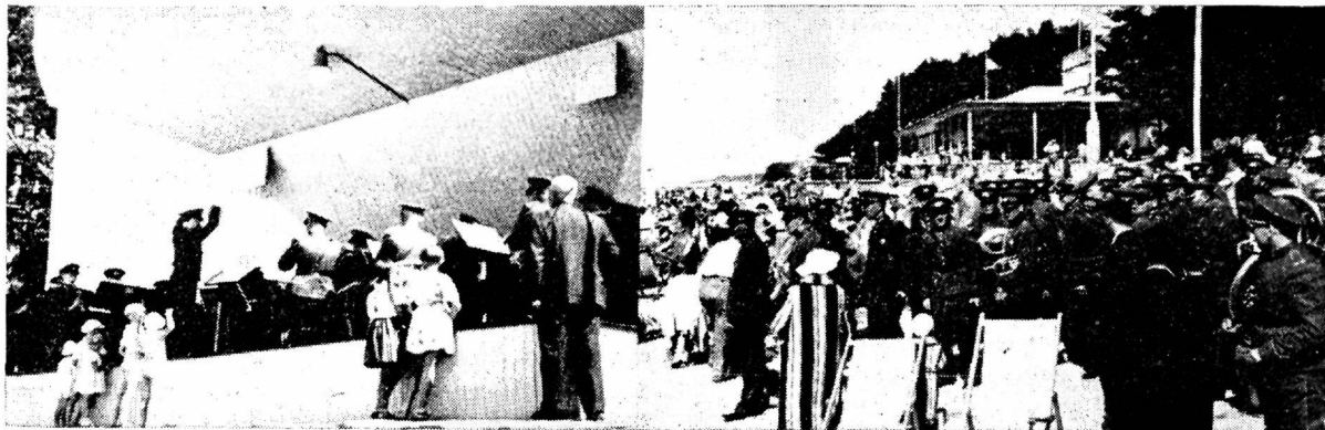
Juulikuus andis Tallinna Politseiametnike Kogu orkester kontserdi Narva-Jõesuus. Pildil näeme: 1) orkester esinemas Narva-Jõesuu kõlakojas ja 2) orkestri liikmeid Narva-Jõesuu plaažil

filmi linastamisload märkusega, missuguses esietenduskinos vastav film esmakordselt linastatakse. Kui film linastatakse mõnes teises kinos ja politseil tekib kahtlus, kas film on tõesti esmakordselt juba linastatud mõnes esietenduskinos, tuleks vastaval politseiametnikul paluda sellekohaseid andmeid Siseministeeriumilt. Tulevikus korraldatakse asi arvatavasti nii, et linastamisloale tehakse filmiinspektorilt märkus pärast linastamist mõnes esietenduskinos, mis muudab politsei kontrolli kõnesolevas osas lihtsaks. Olgu mööda minnes tähendatud, et eelkirjeldatud kord pandi kehtima liig suure filmide arvu sissetoomise piiramiseks välismailt, sest on selge, mida suurem on kinode arv, kus esmakordselt linastatakse filme, seda suurem on üldse välismailt sisseveetavate filmide arv.