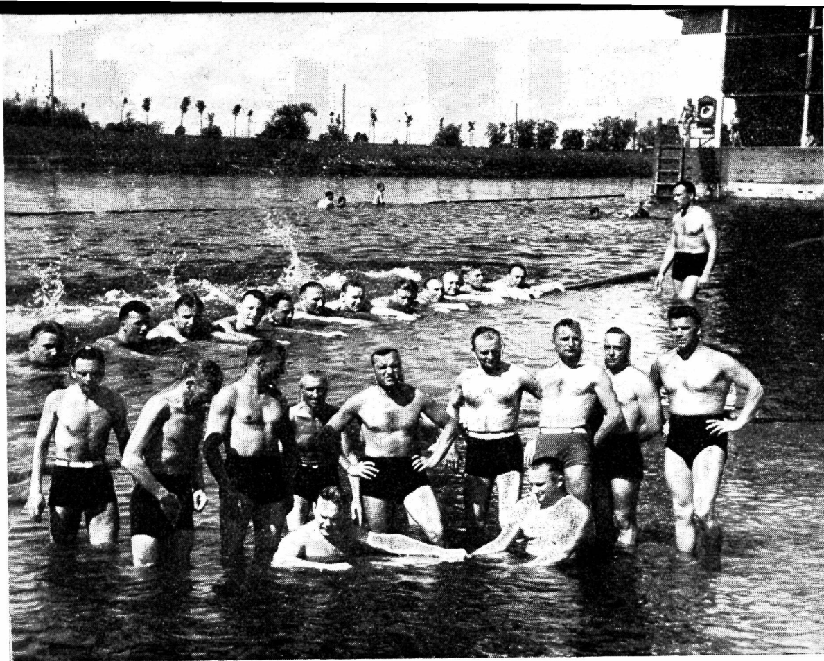
Tartu-Valga prefektuuri politseiametnike vetelpääste- ja ujumiskursusel

ette valmistunud, on kohal hoolega järele vaadatud ja annab väljamõeldud seletuse kooskõlas teopaigal leiduvate asjaoludega. Üksikul juhtumel on see tõesti nii, kuid see ei tohiks vabandada teopaiga unustamist. Jälitaja peab alati oletama, et võib-olla ülekuulata ei käinudki kohaga tutvumas, või käiski seal, kuid see ei jäänud talle meelde või ei suutnud ta märgata iga pisiasja. Tegelik elu on näidanud, et enamjuhtumel see oletus on osutunud õigeks ja täiendav vaatlus asjaosaliste seletuste kontrollimiseks on annud soovitud tulemusi. Süüteo toimija suhtes on päevaselge, et ta tunneb teopaika ja et tema seletus peaks olema kooskõlas seal valitseva olukorraga. Peajoontes see ongi tegelikult nii, kuid iga pisiasja ei suuda temagi tähele panna ega arvestada. Pisiasjad ongi need, mida täiendaval vaatlusel tuleb otsida ja mis sageli aitavad jälitajat, kui ta oskab neid teopaigalt leida ja otstarbekalt hinnata.