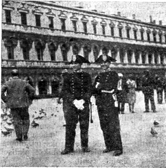
Itaalia riikliku politsei ametnikud.