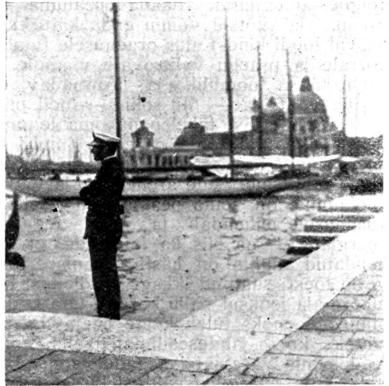
Itaalia omavalitsus-politsei ametnik.